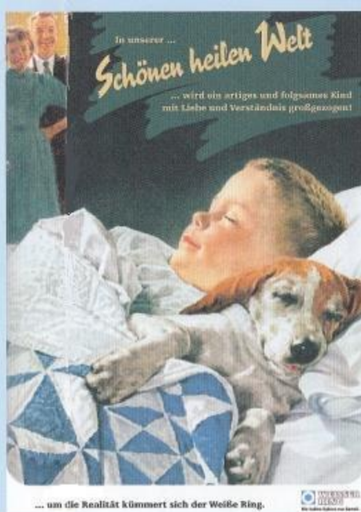
... um die Realität kümmert sich der Weiße Ring.

Kriminalität und Gewalt haben viele Gesichter. Die Ausstellung »Opfer« fordert Mut zum Hinsehen. Wegsehen lässt die Betroffenen im Stich und stärkt die Täter. Wollen wir das?