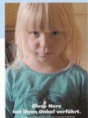
So rechtfertigen sich die Täter. Der WEISSE RING hilft den Opfern.