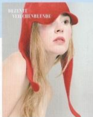
Schützen Sie nicht den Täter, sondern sich selbst.