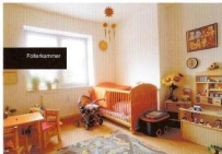
Kinder werden nicht nur vom aggressiven Vater. Diebstahl missbraucht, sondern von allen von verurteilten Menschen. Von Verwandten, Bekannte und Nachbarn. Verdrängt Sie Misbrauch.

Einige Motive der Ausstellung provozieren, schockieren und gehen an Grenzen. Die Bilder setzen ganz bewusst zu eine emotionale Wirkung und erfordern wegen der teilweise sehr drastischen Darstellungen den Mut, nicht wegzuschauen und das Schweigen zu brechen. »Eine wichtige Ausstellung mit Bildern, die zu Herzen gehen. Das wirkliche Leid ist unsagbar schlimmer«, schrieb eine Besucherin ins Gästebuch.