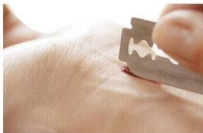
Manche sterben, sind aggressiv oder werden aggressiv. Andere schwingen einbrök.