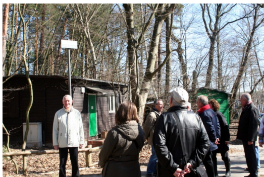
Ehemaliger Polizeiposten Bürgerablage

Sie wurden deshalb durch jeweils drei Grenzsoldaten und einem Offizier besetzt. Heute nutzt ihn die Deutsche Waldjugend als Zentrum für ihre Naturschutzarbeit.