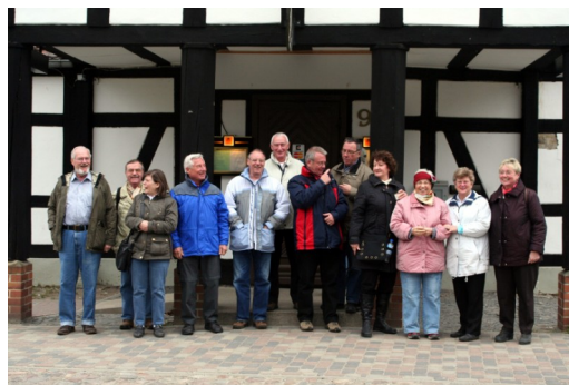
Vor dem Schwanenkrug/Schönwalde

Ein uns entgegenkommendes Ehepaar gab uns den Hinweis, dass nur 1 Kilometer von der Stadtgrenze entfernt in Schönwalde das Lokal Schwanenkrug läge. Es sei geöffnet und die Küche wäre gut.