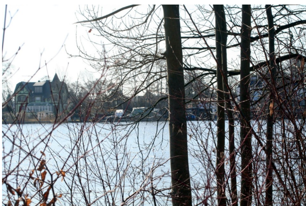
Blick nach Heiligensee

Am 28. März trafen sich 15 Mitglieder der Wandergruppe am S-Bahnhof Hennigsdorf, um die achte Etappe des Mauerweges bis zur Schönwalder Allee zu laufen.