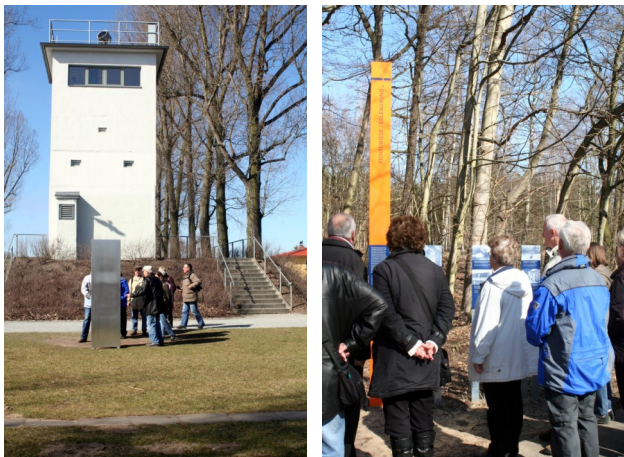
Turm und Erinnerungsstele