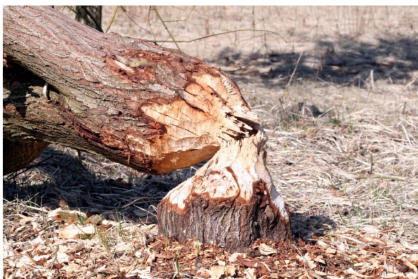
Biberspuren auf dem Mauerweg

Vom Bahnhof sind wir am neuen Rathaus vorbei zum am Oder-Havel-Kanal gelegenen Hafen gelaufen. Hier verläuft der neu-