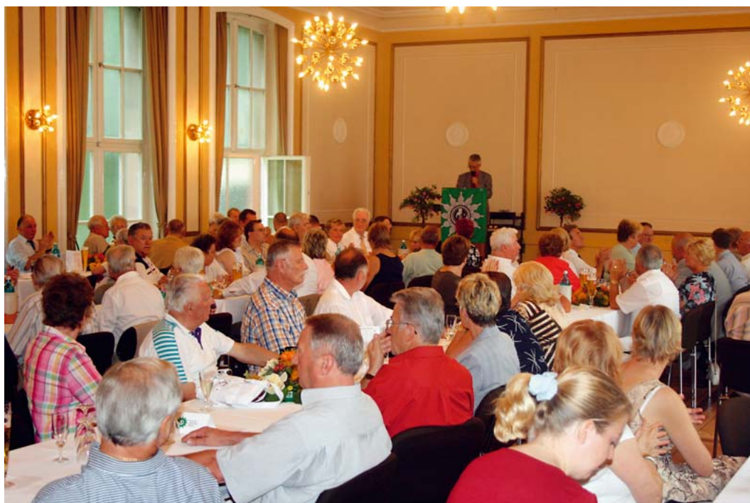
Blick in den Festsaal auf die Teilnehmer

ten Zeiten gesprochen, sondern auch so manche Zukunftsplanung angedacht.