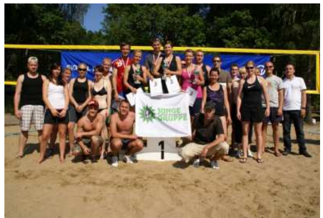
Alle Teilnehmerinnen und Teilnehmer

Glückwunsch allen Platzierten und vielen Dank an alle Teilnehmer und Helfer. Wir bedanken uns auch für die Unterstützung beim Leiter LESE. Ein großes Lob für die hervorragende Organisation an Mathias Ziolkowski.