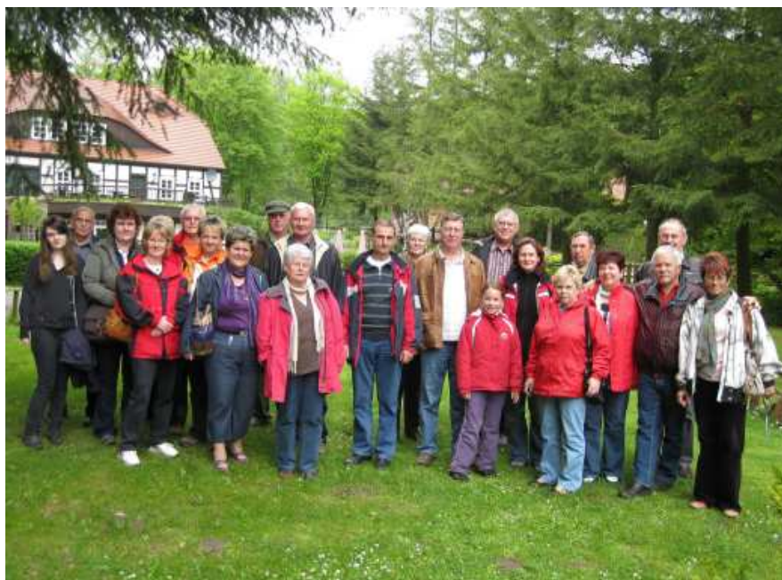
Ein gelungener Abschluss eines schönen Tages in Boltenmühle

am schnellsten Erfolge erzielen. Aber auch das Lob darf natürlich nicht zu kurz kommen, da Tiere auf menschlichen