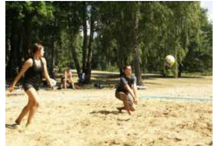
Die späteren Sieger im Spiel

Wetteifern auf vier Spielfeldern mit jeweils vier bis fünf Mannschaften um die gesponserten Pokale und Medaillen der Signal Iduna. Die zwei besten Teams eines Feldes qualifizierten sich für die anschließenden Viertel- und Halbfinals. Gegen 15.00 Uhr wurde das spannende Finale ausgespielt. Der Wettergott war an dem Tag eindeutig ein Gewerkschaftler mit Sympathie für Beachvolleyball. Bei über 30 Grad und durchweg blauem Himmel, kam eine gelegentliche Abkühlung im klaren Wasser des Werbellinsees wie gerufen. Um den Akku wieder aufzufüllen,