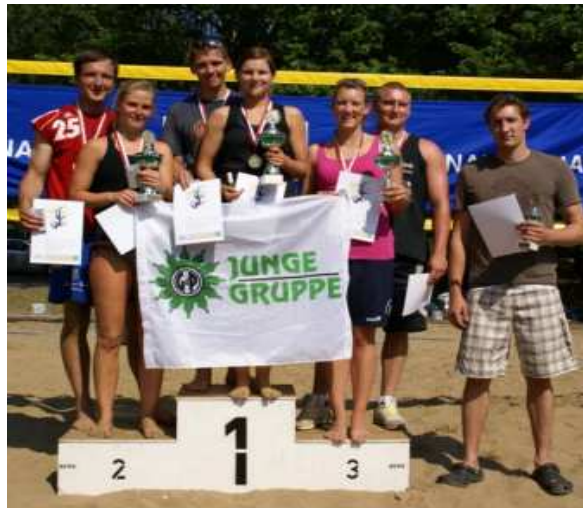
Sieger und Platzierte

konnten sich die Teilnehmer am Grillfleisch und erfrischenden Getränken bedienen.