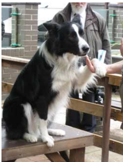
Einer der Stars

Auch diesmal ist es gelungen etwas zu finden, wofür sich einige interessieren. So fuhren wir am 20. Mai 2010 zur Filmtierschule Harsch nach Sieversdorf. Hier werden Tiere von der Eule bis zum Tiger auf ihre Rollen vor der Film- und Fernsehkamera vorbereitet. Die Ergebnisse kann man in vielen verschiedenen Fernsehproduktionen bewundern, so u. a. in Märchenfilmen, Werbetrailern, verschiedenen Serien und auch Musikvideos. Eine 90-minütige Vorführung mit verschiedensten Tierarten, wie z. B. eines Adlers, eines Frischlings, eines sehr verfressenen Seeotters namens Pfeiffer, eines Gepards und natürlich eines Hundes brachte Interessantes und Wissenswertes über die Tiere selbst und ihre Ausbildung ans Tageslicht. Die Charaktereigenschaften der Vierbeiner sind für die Ausbildung eines Fernsehstars von enormer Bedeutung. Auch wird nach dem Belohnungsprinzip trainiert, frei nach dem Motto „Machst Du