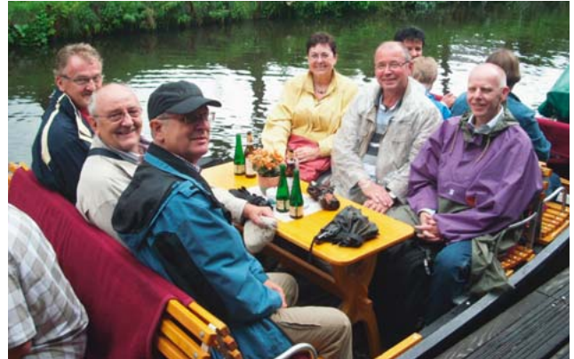
Gute Laune trotz schlechten Wetters

Nach dem Einkauf einiger Spezialitäten aus dem Spreewald ging es uns wieder richtig gut.