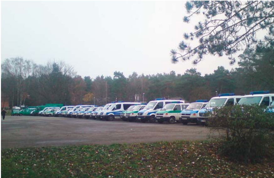
Einsatzfahrzeuge ohne Ende ...

fahrt 4.00! Dann der Einsatz – Absicherung der Bahngleise zur ungehinderten Durchfahrt des Castor-Transportes. Die während des Einsatzes eingehenden Informationen, die Einbeziehung der Verantwortlichen der Unterabschnitte in eine Entscheidungsfindung und die Weitergabe der Informationen an die Einsatzkräfte mag ich hier nicht komplett beurteilen. Es erscheint allerdings der Eindruck, dass die Führung des Unterabschnittes nicht ganz optimal (sehr vorsichtig ausgedrückt) gelaufen ist. Hier wird (wie sicher auch beim gesamten Einsatz) unbedingt eine Nachbereitung erforderlich sein. An mehreren Stellen des Unterabschnittes – nicht aber im zu sichernden Bereich des LESE – erfolgte dann ein Durchbruch von Castor-Gebern. In unmittelbaren Grenzen unseres Abschnittes war dies auch der Fall. Damit ständiger Informationsfluss, Umgruppierung der Kräfte – Hochspannung! Die Einsatzzeit war dann irgendwo bei 20.00 Uhr, also die 4. EHU war zu diesem Zeitpunkt bereits seit 22 Stunden im unmittelbaren Einsatz. Der Abschnittsleiter, der Führungspunkt in Neu Tramm und wir als Personalrat hatten zu diesem Zeitpunkt immer wieder versucht, auf diese Einsatzzeiten hinzuweisen. Um es vorwegzunehmen – gegen 23.00 Uhr wurde die 4. dann herausgelöst. Dazu musste allerdings auch der Vertreter des P-HPR