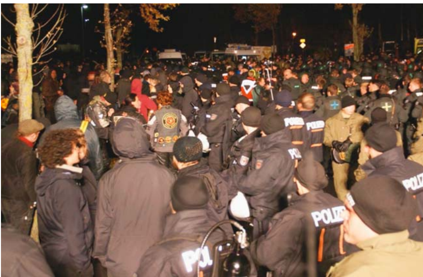
Blockade durch LESE-Kräfte umstellt.

ganisieren – es war keiner mehr da, der eingesetzt werden konnte. Alle Kräfte der Bereitschaftspolizei der Länder waren im Einsatz. Im Gegenteil, es wurde in allen Ländern um eine Entsendung weiterer Kräfte ersucht.