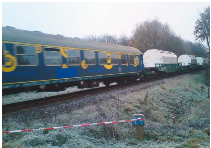
Der „Stein des Anstoßes“ ...

traf alles Sonnabend den 31. 10. 2011! Die restlichen Kräfte – 1. und 2. EHU, TEE sowie Stab hatten ab 5.00 Uhr MOZ! Dies bedeutet, aufstehen 3.00 Uhr, Ab-