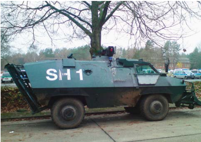
Auch schwere Technik vor Ort – nur zum Anschauen?