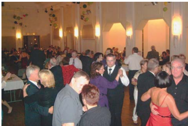
Super Stimmung in tollem Ambiente.