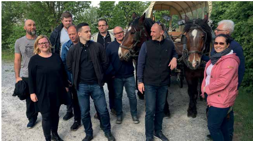
Gute Stimmung – auch beim Kutscher – während der VL-Schulung unserer Frankfurter Kolleginnen und Kollegen.

Es wurden dabei Attribute wie die Folgenden umfassend beleuchtet: Eigeninitiative, Selbstständigkeit,