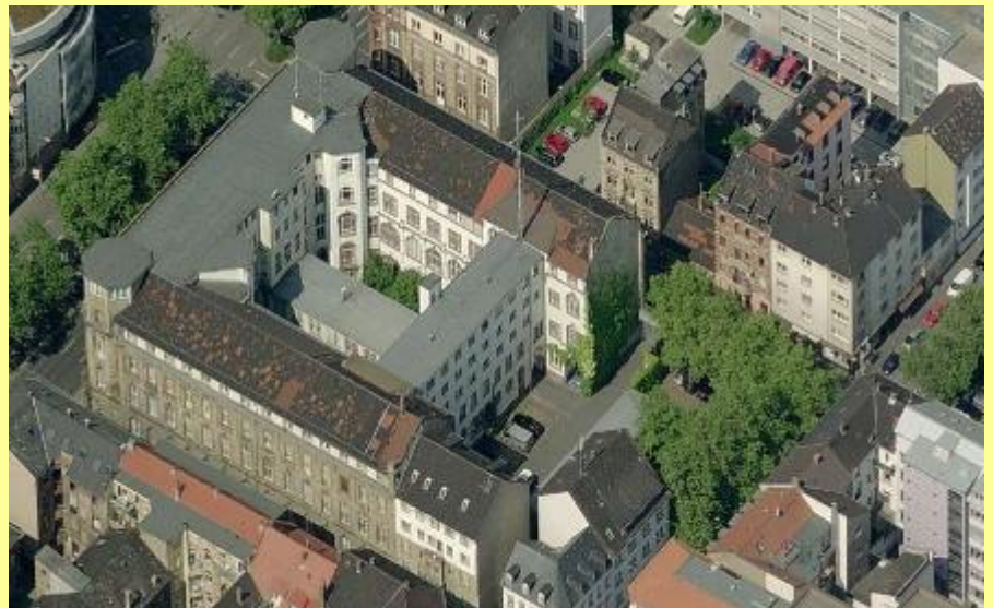
Das Mannheimer Polizeipräsidium aus östlicher Richtung. Gut sichtbar der Innenhof mit den einzelnen Hintereingängen. (Kleine Fotos unten: ) Die Draufsicht wie bei Google Earth (linkes Foto) oder aus nördlicher Richtung das Schrägbild auf der Homepage der Stadt Mannheim.