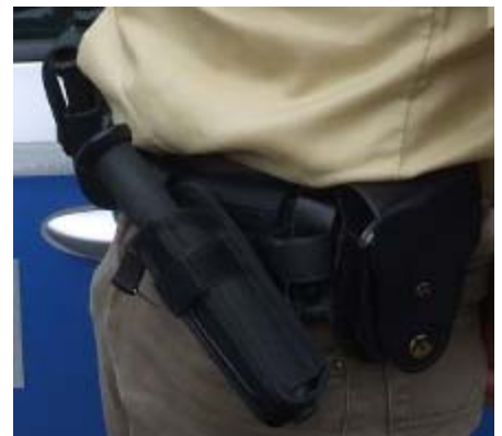
Schon das „Klick“ beim Ausziehen verschafft Respekt: Hier im Holster und der abgebrochene alte Stock.

frischung vorgesehen. Schließlich könne der massive Stahl „schon eine hohe Schmerz- wirkung“ entfalten.