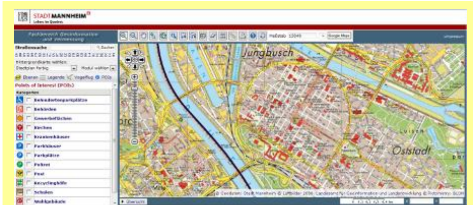
Auf der Internetseite der Stadt Mannheim kann man jedes Objekt z.B. Privathaus mit der Adresseingabe suchen und mit Schrägbildern aus allen Himmelsrichtungen darstellen lassen.

In Mannheim wurden im Frühsommer 2009 Bilder gemacht. Google muss bei diesen Aufnahmen Anforderungen des Datenschutzes beachten, so der Beschluss der obersten Datenschutzauf-