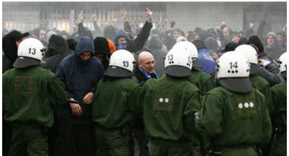
Polizei-Einsatzkräfte bei der Randal zwischen den Erzrivalen Hamburger Sportverein (HSV) und dem FC St. Pauli