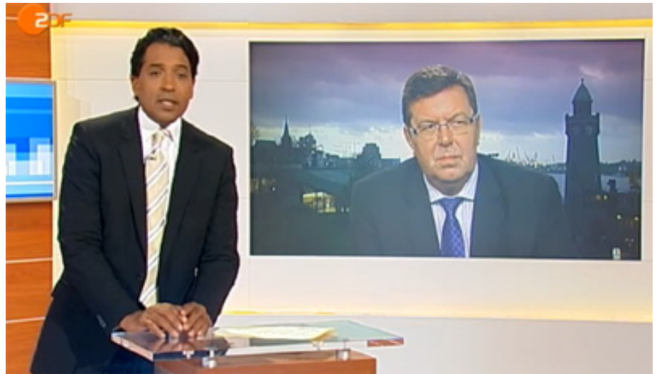
GdP-Bundesvorsitzender Konrad Freiberg live im ZDF-Morgen-Magazin

Konrad Freiberg, GdP-Bundesvorsitzender: „Es war höchste Zeit, den fatalen Koalitionsstreit auf dem Rücken der Sicherheitsinteressen von Bürgerinnen und Bürgern und nicht zu-letzt der Polizei beizulegen.“ Zufrieden könne man jedoch keineswegs sein. Solange die Reform nicht in Kraft sei, würden zusätzlich zu den bereits freigelassenen womöglich noch weitere gefährliche Täter entlassen werden müssen. Das sei, so Freiberg, eine bittere Konsequenz des unnötig langen Schaukampfes zwischen den Koalitionsfraktionen. Freiberg: „Um diese sich in Freiheit befindlichen Täter muss sich nachwievor allein