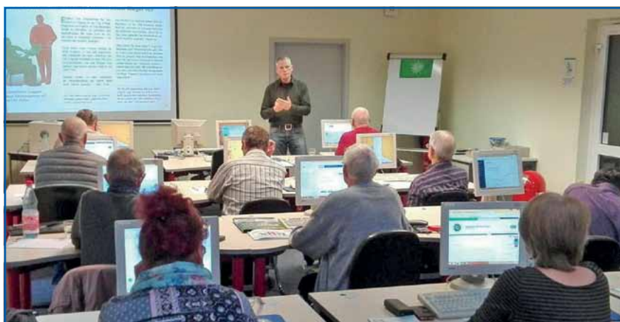
Internet – eine Welt für sich, von Andreas Grünthal verständlich erklärt.