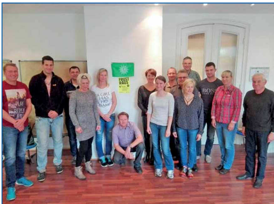
„Alte“ Seminarhasen und Seminarneulinge ;-)

doch noch nicht überall rum gesprochen). Sie waren, wie die restlichen Seminarteilnehmer, rundum zufrieden.