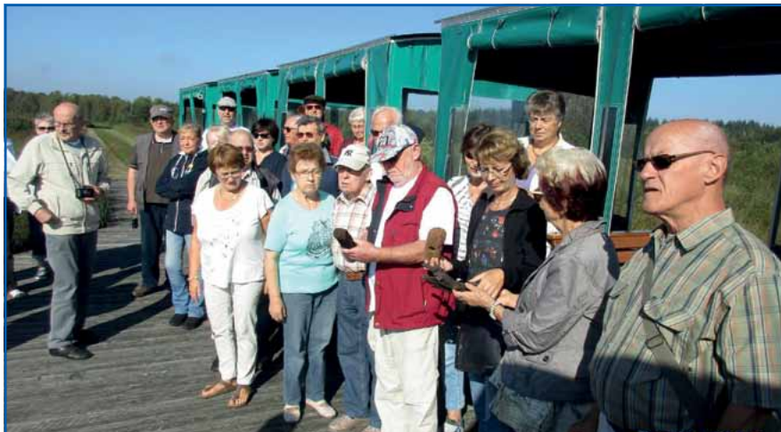
Fahrt mit der Ahlmoorbahn

so dürft ihr, liebe Kollegen, durch meinen „Bericht“ ein wenig Anteil an unserer „Seniorenfreizeit“ haben. Doch ich will nicht so detailliert im Einzelnen berichten. Wie schon anfangs erwähnt, fünf Tage in der Nähe von Bremerhaven, nämlich in Bad Bederkesa.