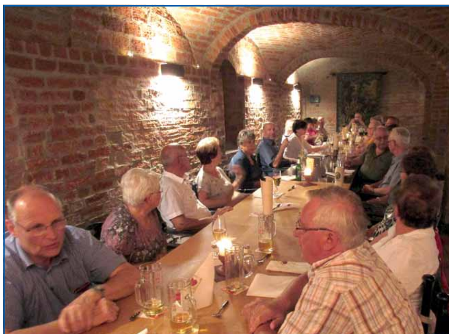
Gemütlich im Burgkeller

Fahrten mit dem Bus durch das flache Land, das Geestland, keine Antwort auf gestellte Fragen schuldig. Es war für alle ausreichend Möglichkeit, sich auch außerhalb der „Truppe“ auf die eigenen Bedürfnisse zu besinnen. Trotz Fahrt mit der Ahlmoorbahn durch unberührte Natur, einer Stadtführung durch Ottendorf, Torteessen im Strandbad von Bad Bederkesa war ausreichend Zeit für alle Abteilungen der großen Moortherme am Hotel