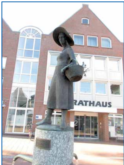
Die einkaufende Hausfrau

Aber ich glaube, dass es allen Teilnehmern dieser Gruppe fast egal ist, wohin die Reise geht. Nach jetzt sieben gemeinsamen Kurzurlauben hat sich ein so fester Zusammenhalt aufgebaut, dass sich alle auf das Wiedersehen mit alten Bekannten freuen. Und dabei kommen die Episoden aus der Dienstzeit auch nicht zu kurz. Es sind einfach fünf Tage im Jahr, die wir, wenn die Zeit näherrückt, kaum noch erwarten können und wie in jedem Jahr,