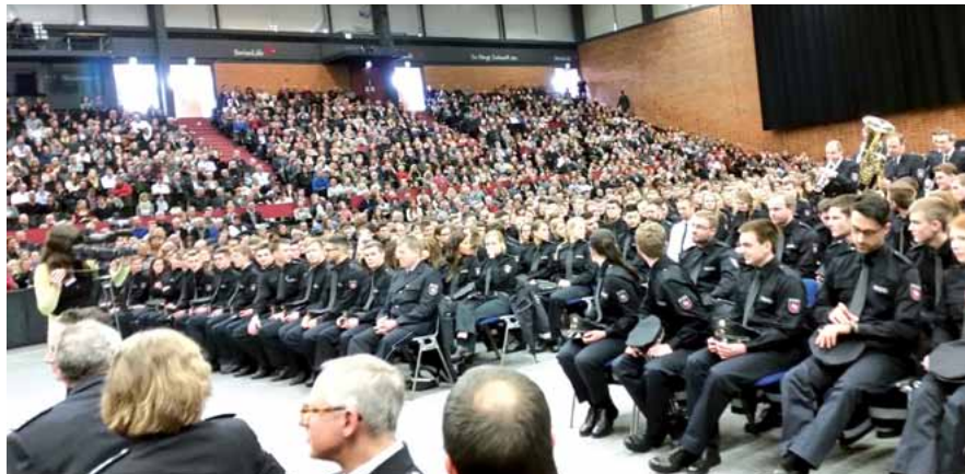
Vereidigung der Polizeiakademie Niedersachsen 2015