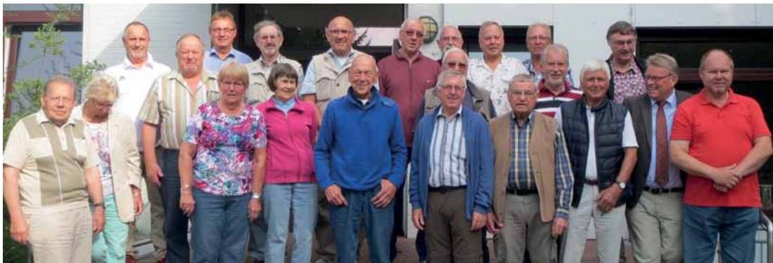
Die Teilnehmer des Seniorenseminars

Themen des neuen Erbrechts, des Verbraucherschutzes und der Entwicklung der Landespolizei bildeten Schwerpunkte des diesjährigen GdP-Seniorenseminars