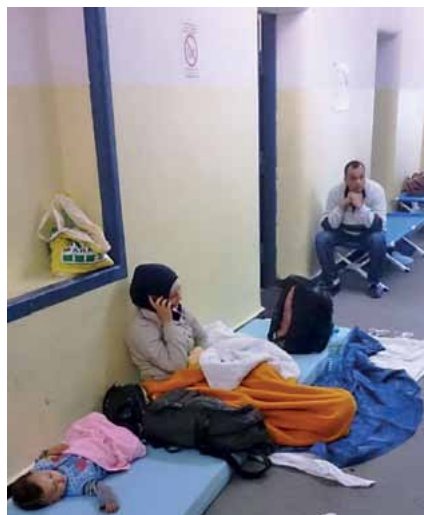
Auch die Flure werden zur Übernachtung genutzt.

ches Personal ist erforderlich. Zudem ereignen sich außerhalb der normalen Stationsdienstzeiten Konflikte, die dann von dem normalen Streifendienst wahrzunehmen sind und diese Kräfte binden. Gerade in den letzten Tagen vor unserem Besuch gab es häufiger polizeiliche Einsätze. Eine klare Auswirkung auf den „normalen“ Streifendienst. Inzwischen erfolgt eine Unterstützung durch die Bereitschaftspolizei. Diese Kräfte stehen dann für andere Anlässe natürlich