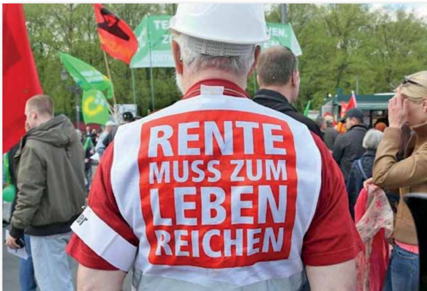
Die Rente muss für ein würdiges Leben reichen.

Damit die Rente auch morgen reicht, müsse das Rentenniveau zu-