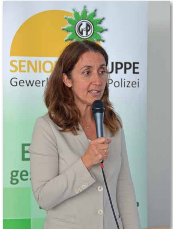
Staatsministerin Aydan Özoguz beschrieb ausführlich und anschaulich die wesentlichen Arbeitsfelder als Beauftragte für Migration, Flüchtlingen und Integration

Frau Özoguz ging auch auf die steigende Zahl der Asylsuchenden ein, so wird die Zahl der Anträge auf 400 000 in 2015 geschätzt. Der Stadtstaat Hamburg wird davon 2,53% der Schutzsuchenden aufnehmen müs-