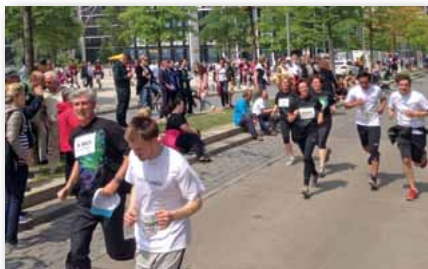
Auf dem Weg ins Ziel!