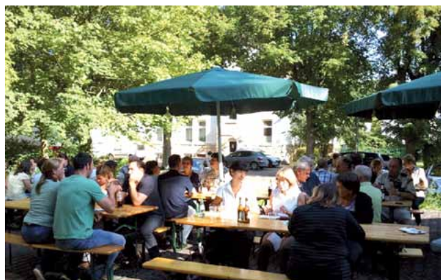
Grillfest der Bezirksgruppe PZBH auf dem Gelände des PTLV.