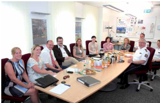
Besuch von Nancy Faeser (Innenpolitische Sprecherin SPD).

Wie Ihr auf den Bildern unschwer erkennen könnt, versuchen wir viele gemeinsame Aktionen für die