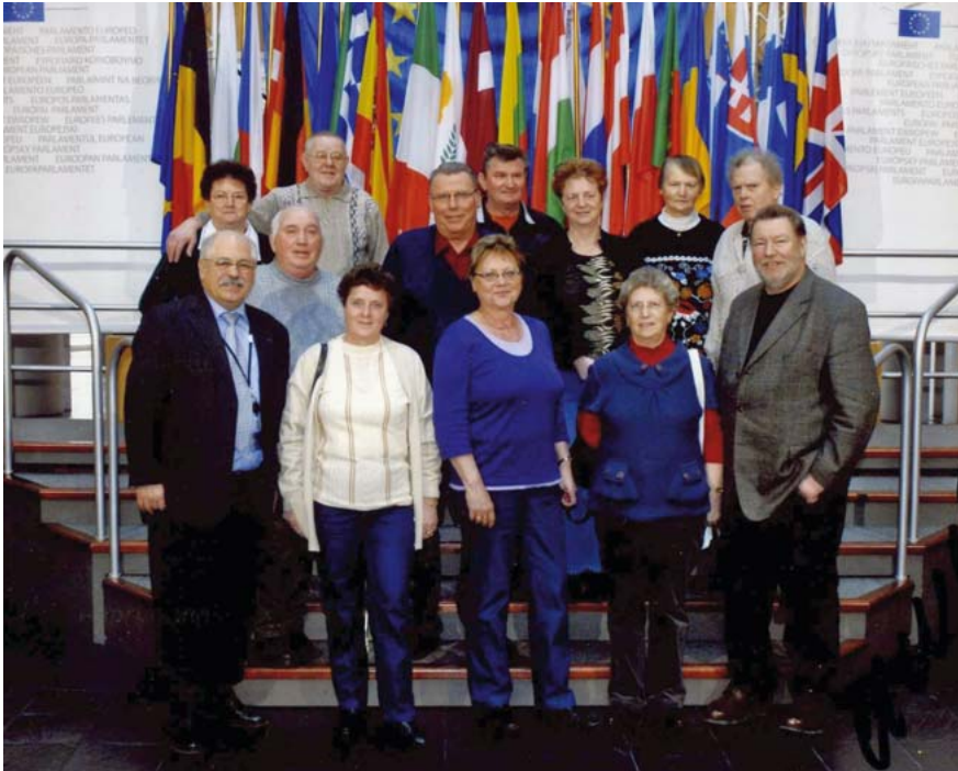
Die Mitglieder der Seniorengruppe Weißenfels im Plenarsaal des Europäischen Parlaments in Strasbourg.