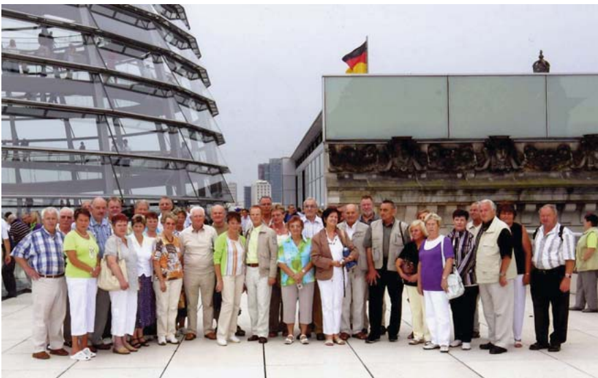
Die Mitglieder der Seniorengruppe Weißenfels und Teilnehmer des „Deutschen Bundeswehr-Verbandes, Standort Kameradschaft Weißenfels, Kameradschaft Ehemalige“ auf dem Dach des Reichstagsgebäudes.