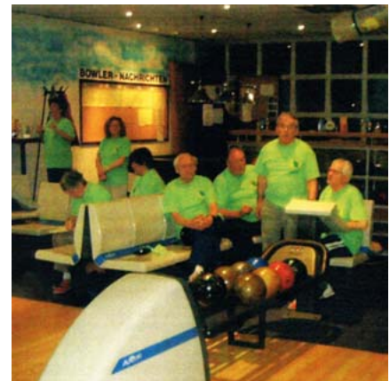
Die Mitglieder der Seniorengruppe Bitterfeld-Wolfen beim Bowling-Cup-Turnier.

Klaus Düring www.gdp.de/gdp/gdpls.a.nsf/id/20100607