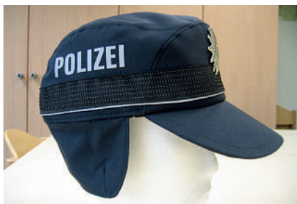
Chic, aber für den Polizeialltag ungeeignet: das im vergangenen Jahr getestete Basecap für die Wintermonate.

Im letzten Winter wurde in den Behörden Aachen, Kleve und Olpe ein Trageversuch mit einem gefütterten Basecap mit ausklappbarem Ohrenschutz durchgeführt (DP 12/2010). Nach Informationen, die der GdP vorliegen, hat der Probelauf nicht zu dem erhofften Ergebnis geführt.