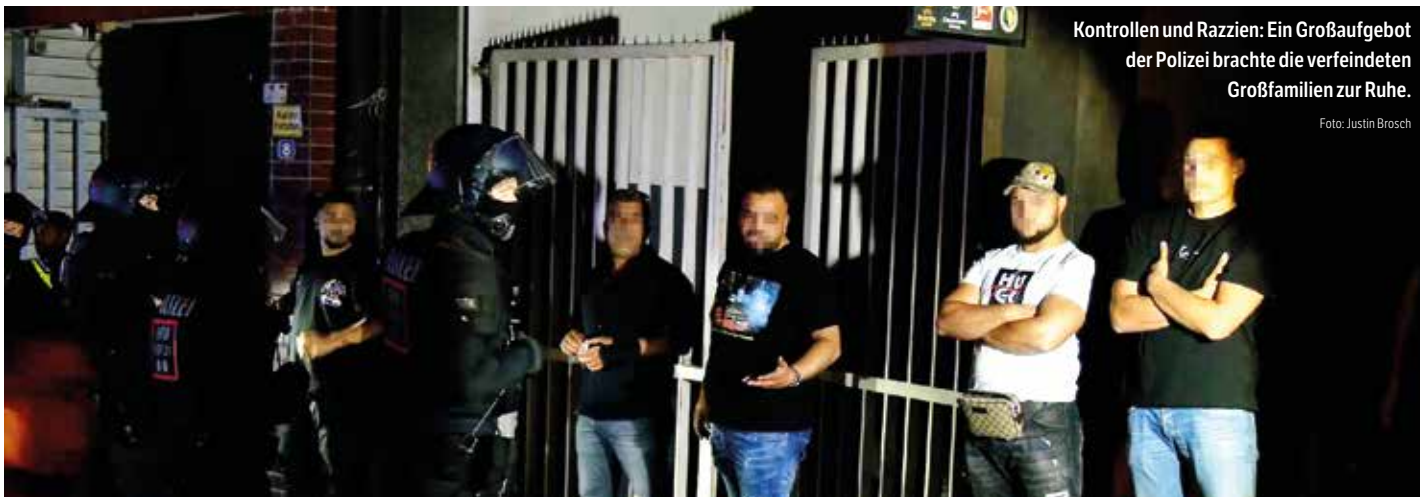
Kontrollen und Razzien: Ein Großaufgebot der Polizei brachte die verfeindeten Großfamilien zur Ruhe.