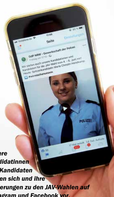
Unsere Kandidatinnen und Kandidaten stellen sich und ihre Forderungen zu den JAV-Wahlen auf Instagram und Facebook vor.

Mehr Infos zu den Kandidatinnen und Kandidaten der GdP und zur Öffnung der Wahllokale vor Ort unter: www.gdp-nrw.de