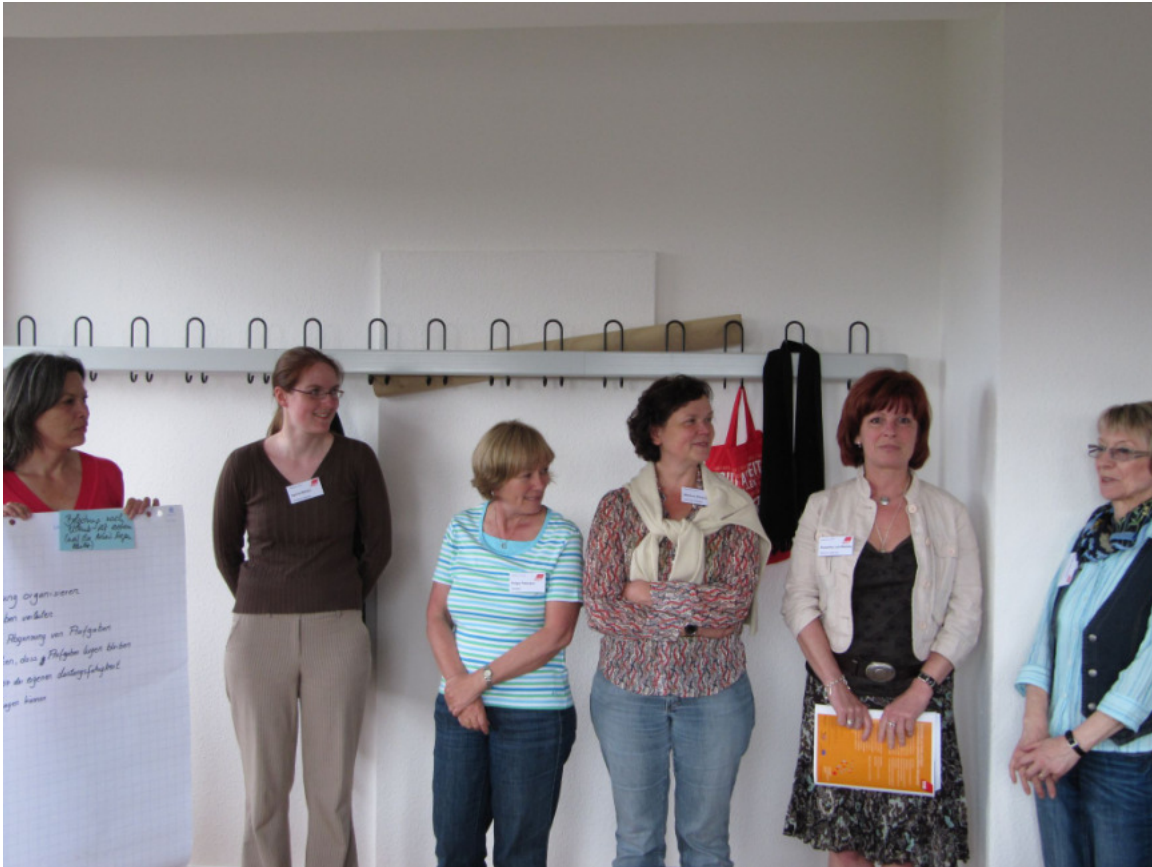
Positive Faktoren für eine gelungene Work-Life-Balance

⊕ Faktoren für Work-Life-Balance * Abgrenzen ; „Nein“ sagen * seine Rechte als AN wirklich nutzen / durchsetzen * Rückgrat zeigen! * Aufgabengebiete klar verteilen + delegieren (z. B. im Freiraum ) * mit sich selbst in Rein sein * sich strukturieren * Proritäten setzen! (auch für's Privatleben) * Zeitmanagement : sich selbst nicht überfordern * nicht alle Probleme zu meinen machen * Netzwerke suchen / Verbündete! * reflektieren: „Was will ich + warum?“ – Klarheit in der eig. Rolle