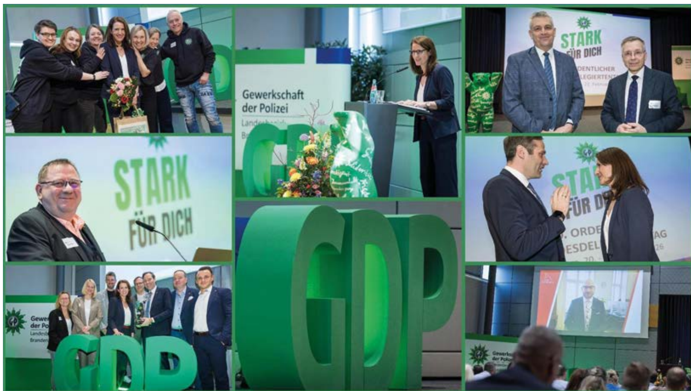
Gäste, Glückwünsche und Redner auf dem Landesdelegiertentag