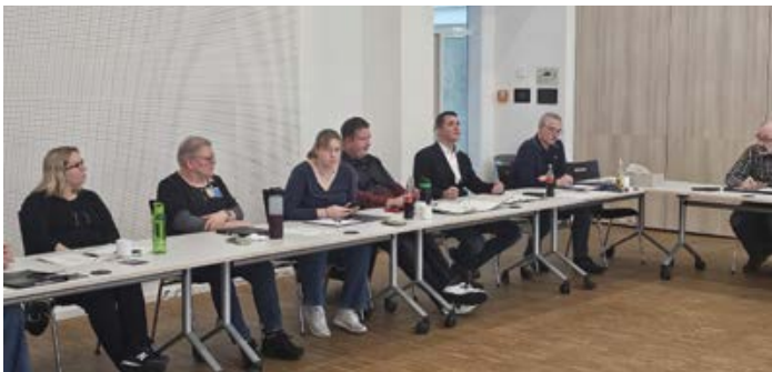
Südosthessen: Austausch zu den Anträgen der Bezirksgruppe