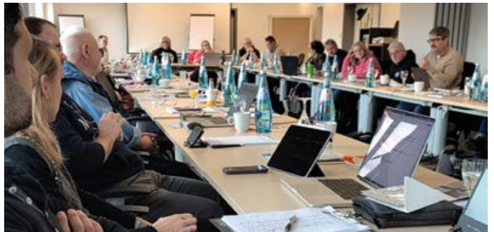
Südhessen: Delegiertentagung für eine noch zukunftsfähigere GdP