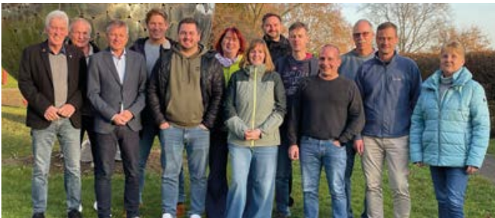
HPE: Bezirksdelegiertenklausur des HPE im Vorfeld des Landesdelegiertentages 2026