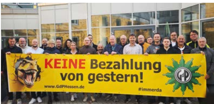
Westhessen: Das aktuelle Urteil des BVerfG zur Berliner Besoldung wurde bewertet und die Forderung nach einer verfassungsgemäßen Besoldung wurde gestellt!