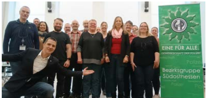
Südosthessen: die Delegierten der Bezirksgruppe Südosthessen