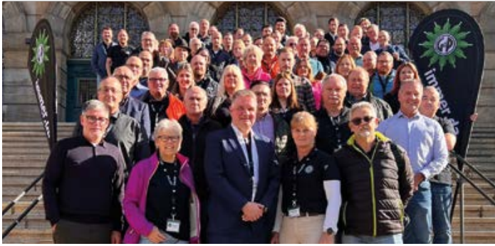
Nordhessen: auf der Treppe vor dem Rathaus