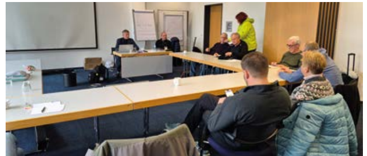
HPE: Die Bezirksgruppe bewertet Tarifrufumfrageergebnisse.