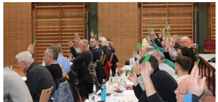
Mittelhessen: die Delegierten bei der Abstimmung