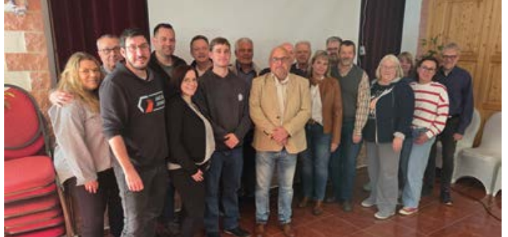
Osthessen: der neu gewählte Vorstand der Bezirksgruppe Osthessen