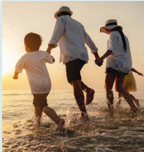
Sehnsucht nach Meeresrauschen