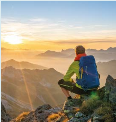
Herrliche Wanderreisen und mehr