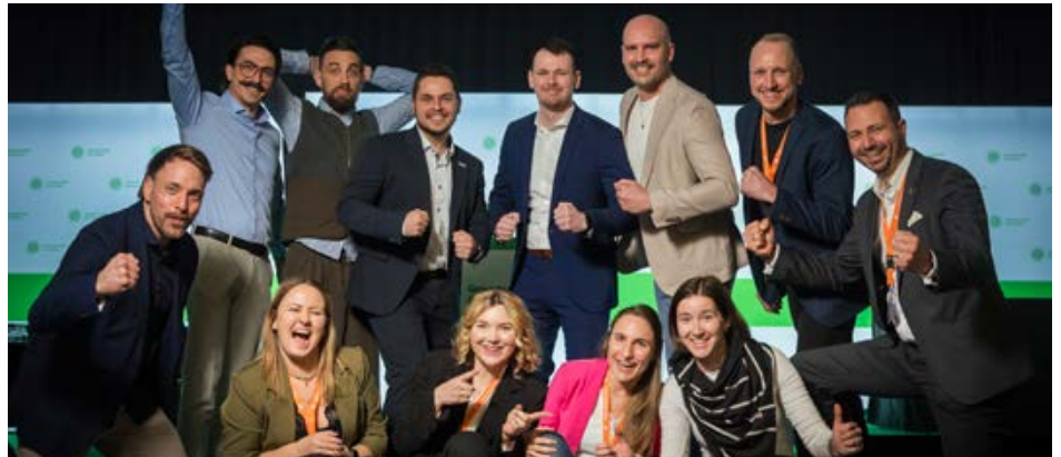
8. März 2026, Berlin, Deutschland, 60 Jahre JUNGE GRUPPE (GdP)