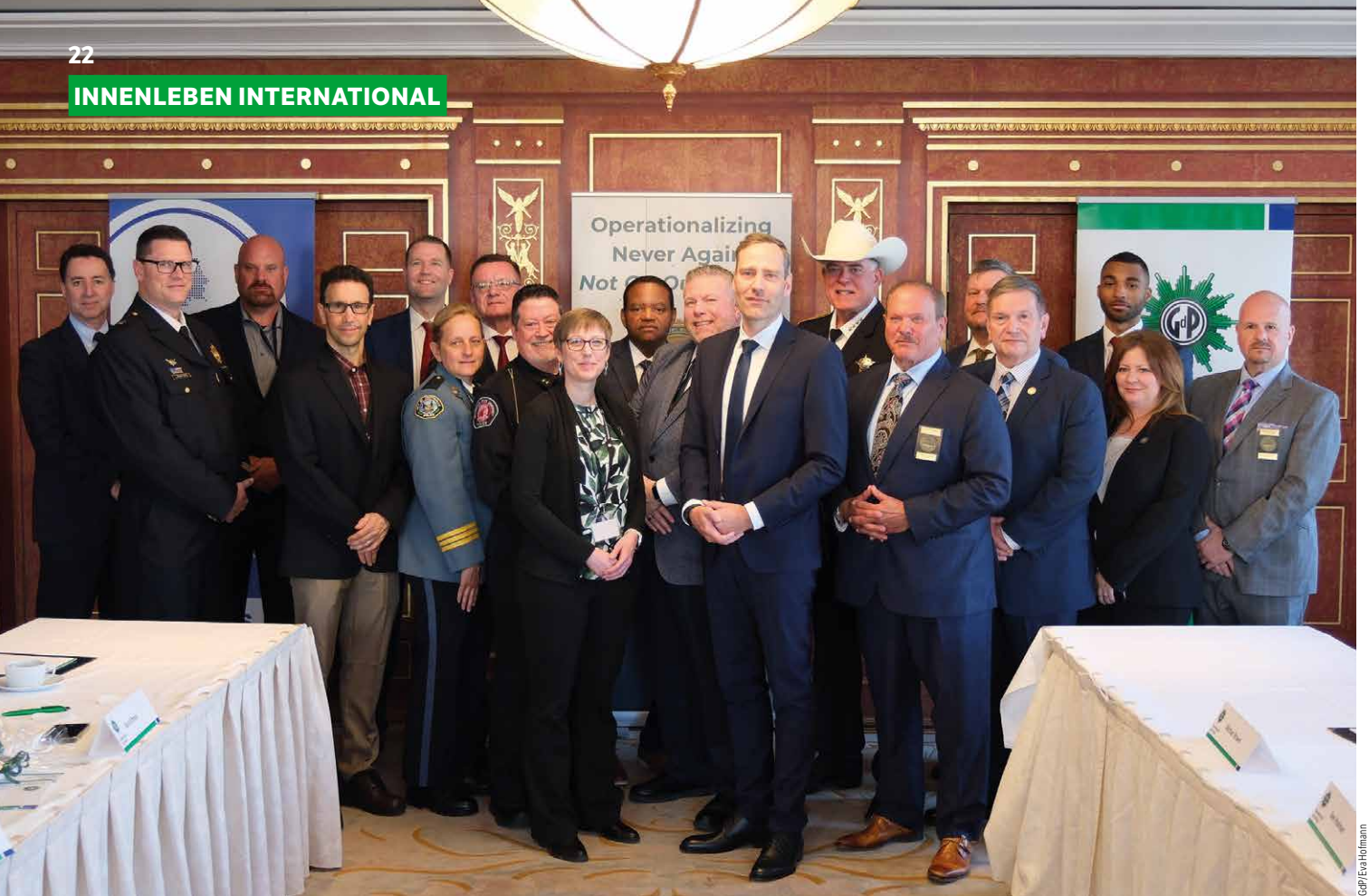
Alle Teilnehmenden auf einen Blick: Die Democratic Policing Initiative will wichtige Konzepte für eine resilientere Demokratie und starke demokratische Polizeiarbeit entwerfen und umsetzen.