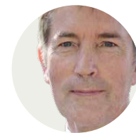
DP-Autor Peter Schlanstein

Zum Beginn der Motorradsaison zeigt sich erneut: Sicherheit entsteht nicht von selbst. Sie muss gestaltet werden – auf der Straße, im Fahrzeug und im Kopf. ■