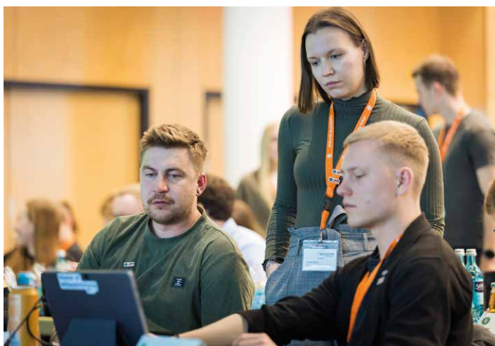
Nicht jeder Beschluss fiel leicht.