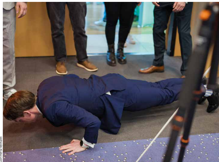
Für welche Alternative haben sich wohl die meisten entschieden?