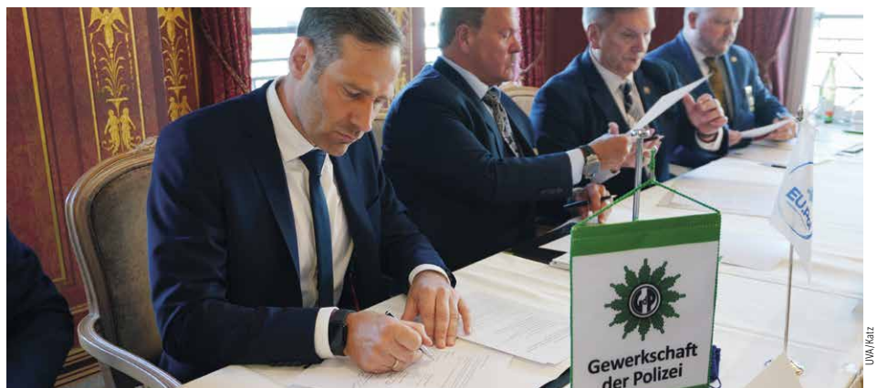
Feierliche Unterzeichnung des Memorandum of Understanding.