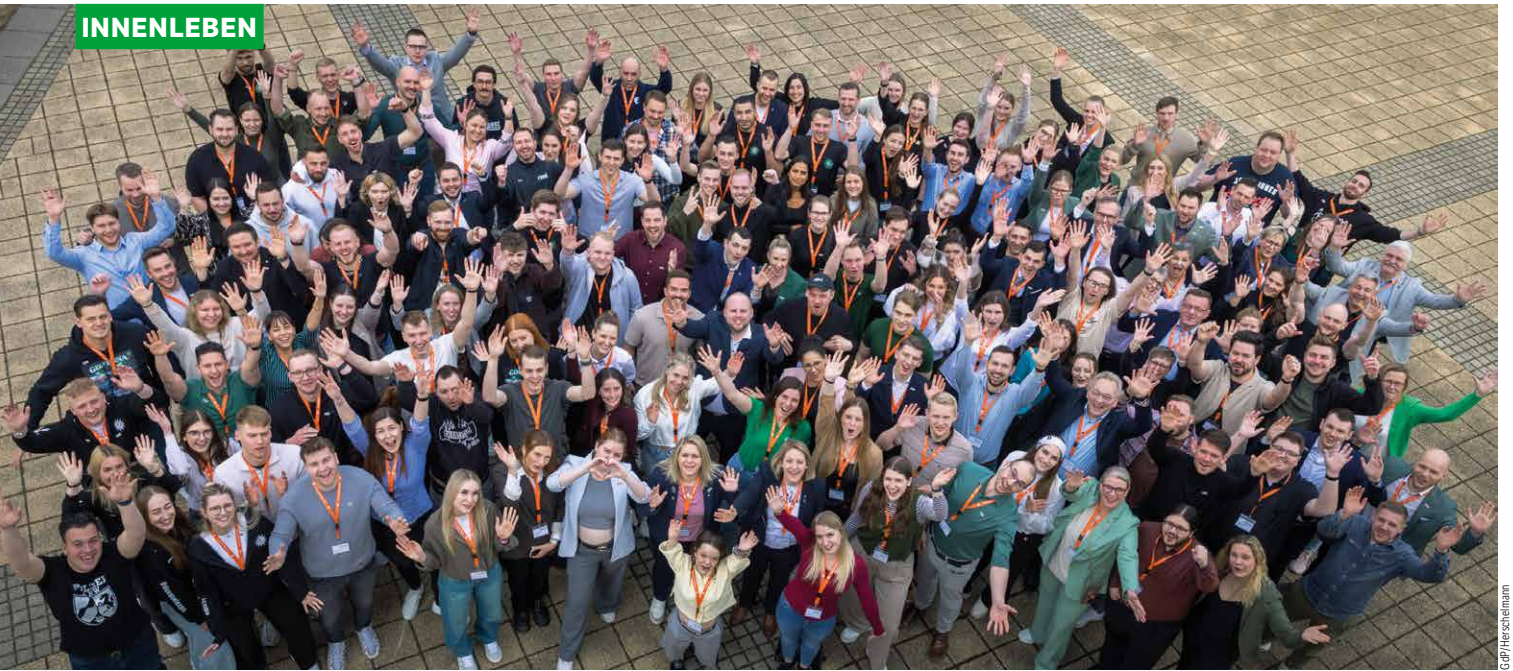
Eine Einheit: Die Teilnehmenden formierten sich für den Fotografen.