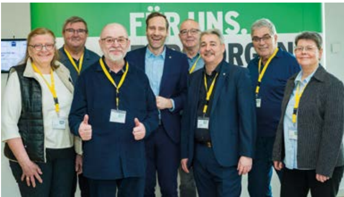
23. Februar 2026, Berlin, Deutschland: 10. Bundesseniorenkonferenz der GdP

Als ich vom Vorsitzenden der GdP-Senioren Sachsen die Einladung für eine 2-Tages-Konferenz nach Potsdam bekam, war ich sehr erstaunt. Warum gerade ich? Ich bin doch nur stellvertretender Seniorengruppenvertreter und Lektor beim Lehrgang „Vorbereitung auf den Ruhestand“ zusammen mit anderen Senioren. Bei der Konferenz sollten die Vertreter für den neuen GdP-Seniorenbundesvorstand gewählt und jede Menge Beschlüsse gefasst werden. Und das alles auch noch digital mit einem Online-Programm, was ich bis dato noch nicht kannte.