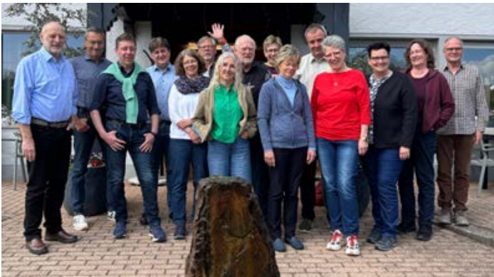
Mit gelungenen Inhalten konnte das Seminar „Vorbereitung auf den Ruhestand“ punkten