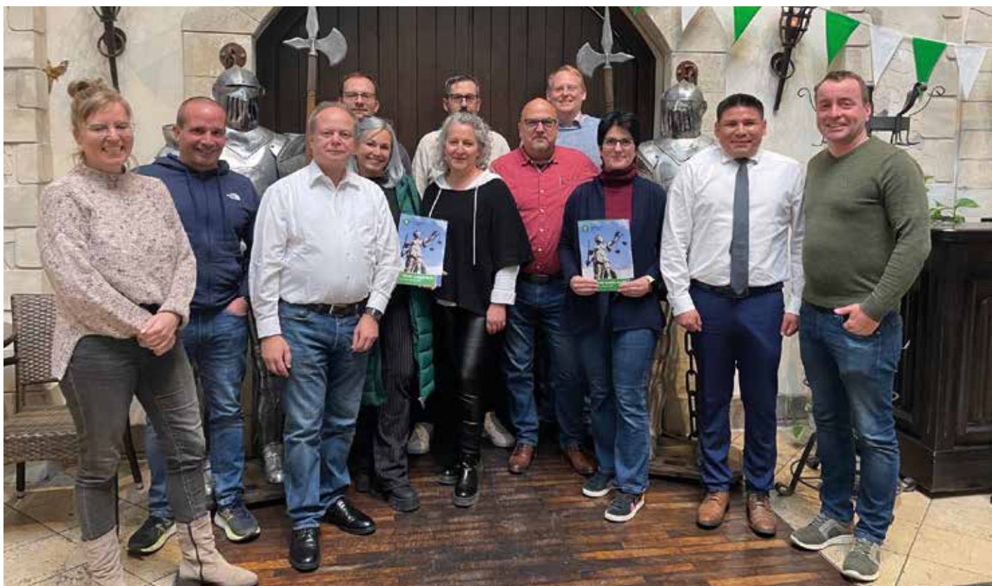
Sitzung der Rechtsschutzkommission