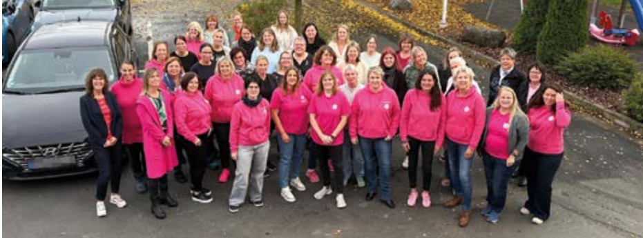
Alle Teilnehmerinnen der Landesfrauenkonferenz