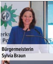
Bürgermeisterin Sylvia Braun