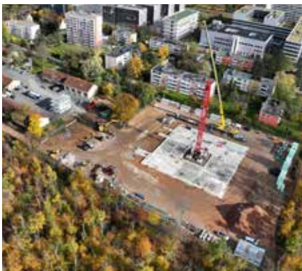
Luftbildaufnahme Ende Oktober 2025

Die Bauleitung ist (wie auf dem Foto links erkennbar) nun auch in einem dreistöckigen Containerbau untergebracht.