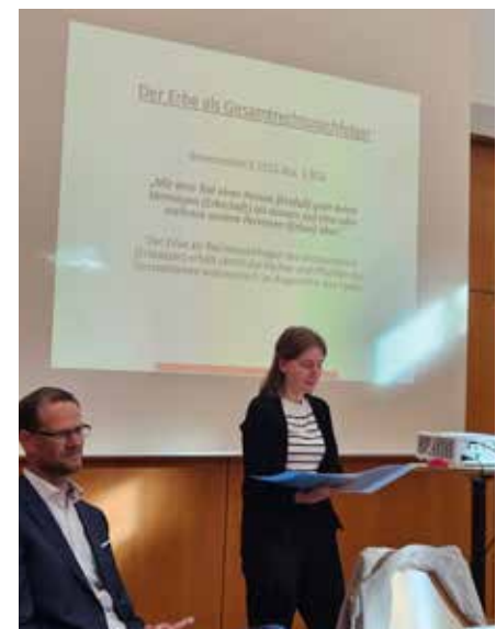
Die sachkundigen Referenten