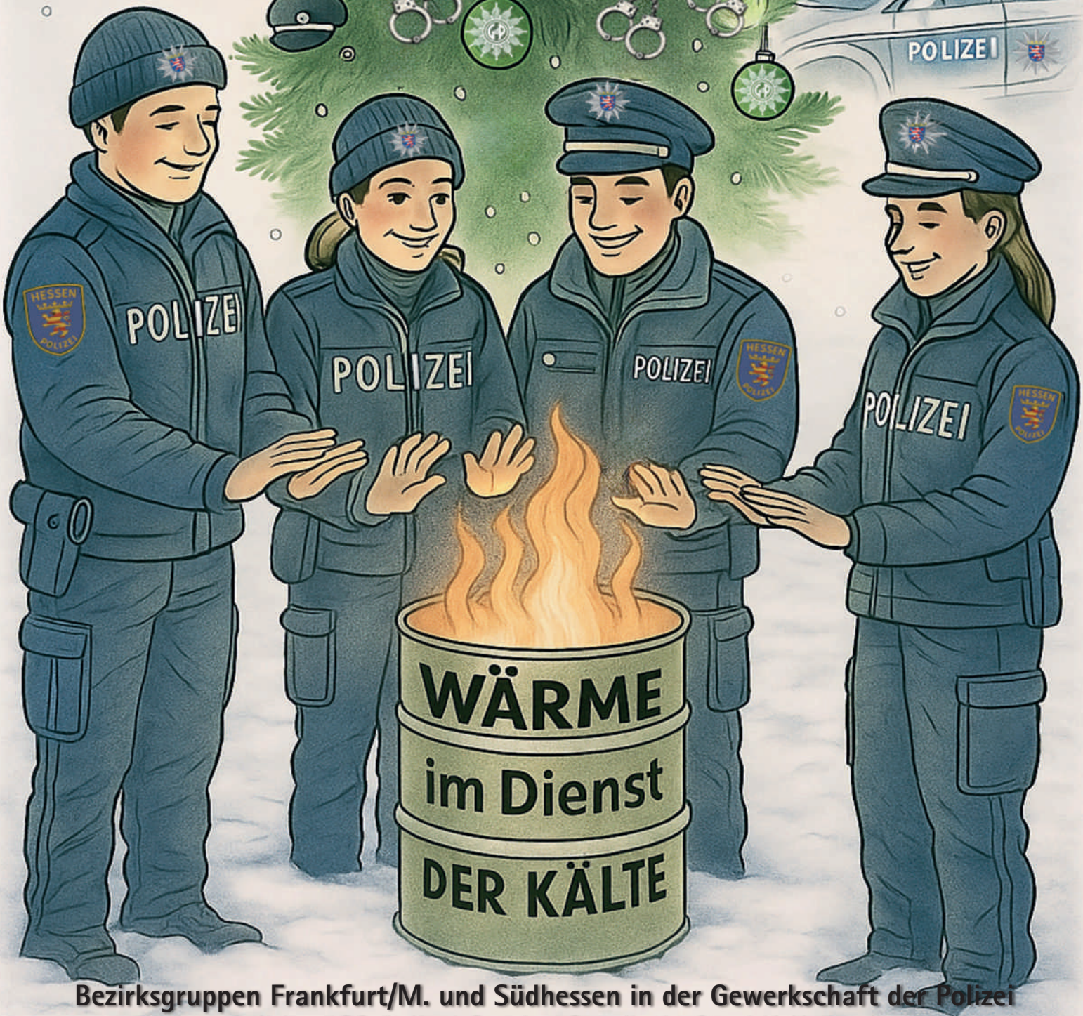
Bezirksgruppen Frankfurt/M. und Südhessen in der Gewerkschaft der Polizei und der PSG Polizei Service Gesellschaft mbH Hessen