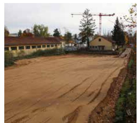
geplante Baustraße hinter den Garagen vor Beginn und aktueller Zustand