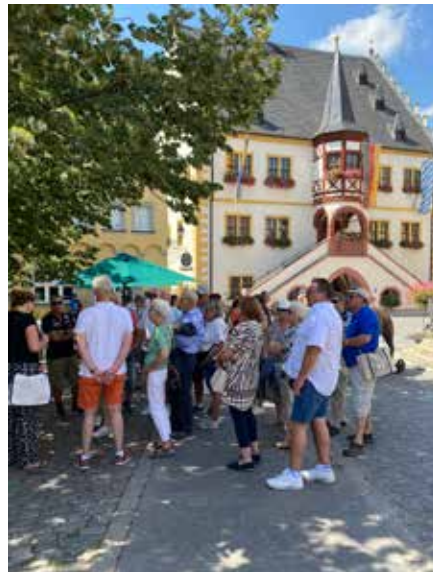
Aufmerksame Zuhörer bei der Stadtführung

nach Volkach genießen. Das beste Wetter hat es aber für alle schweißtreibend gemacht, denn die vorhandenen Fenster in diesen Wagen sind von der Größe her mit Schießscharten zu vergleichen. Leider mussten zwei Mitfahrer sich danach abholen lassen.