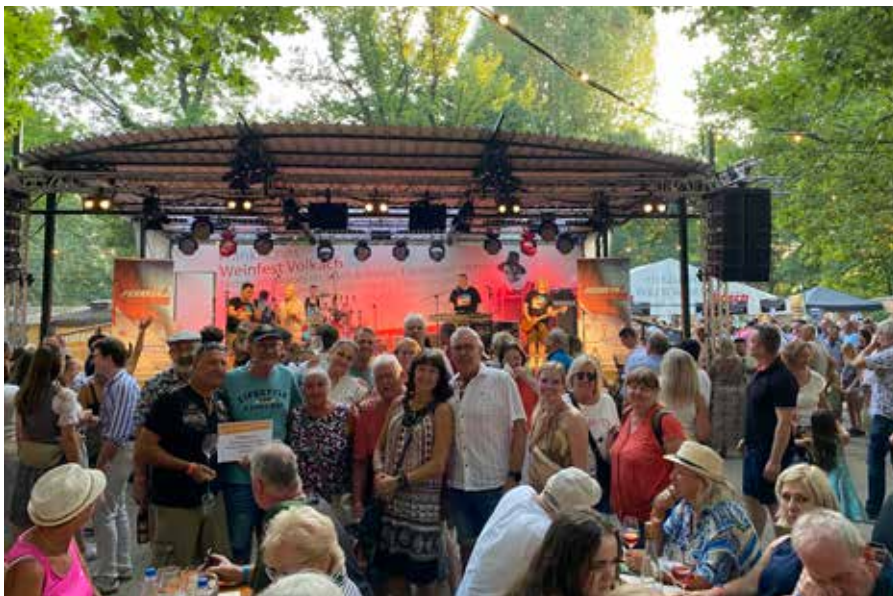
Abschlussfoto vor der Tribüne

Anschließend ging es direkt auf das Weinfest, wo der Eintritt bereits bezahlt und die Platzkarten organisiert waren.