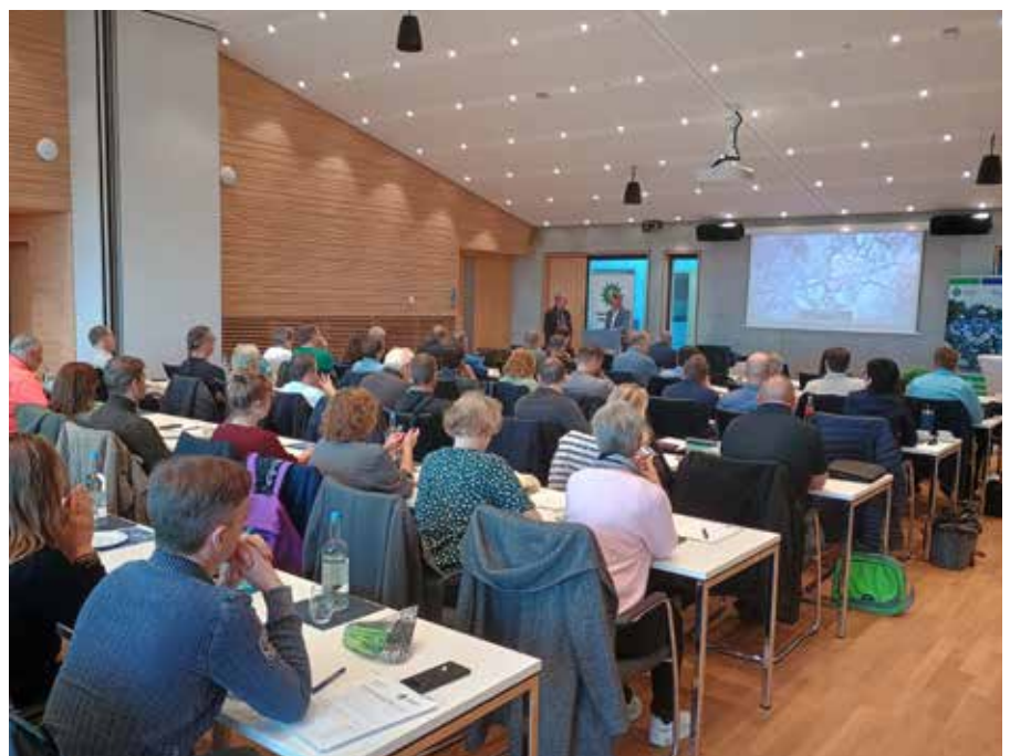
Der Beirat tagte zum ersten Mal in Bruchköbel