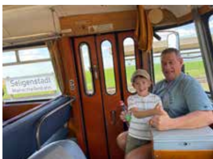
Toaster mit Enkel am Führerstand

nach Volkach genießen. Das beste Wetter hat es aber für alle schweißtreibend gemacht, denn die vorhandenen Fenster in diesen Wagen sind von der Größe her mit Schießscharten zu vergleichen. Leider mussten zwei Mitfahrer sich danach abholen lassen.