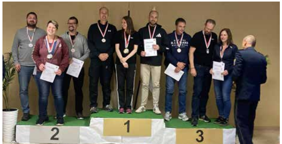
Dienstpistole gemischte Mannschaft 2. und 3. Platz