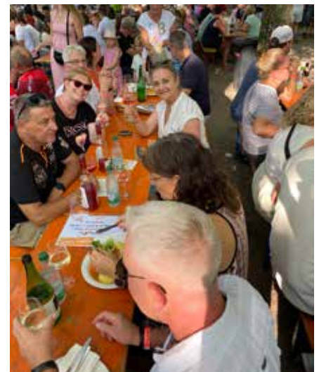
Gute Laune auf dem Weinfest

Als älteste Pfarrei der Region an der Mainschleife weist die Wallfahrtskirche eine reiche Geschichte auf. Über die Jahrhunderte von Kriegen und Zerstörung bedroht, wurde sie vor allem durch einen spektakulären Kunstraub in den Medien bekannt.