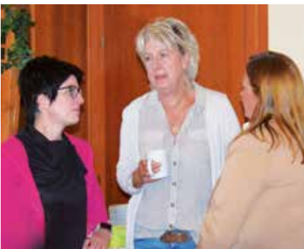
Frauenpower bei den Senioren

Das galt auch für einen Dringlichkeitsantrag des Landesseniorenvorstandes. Er befasst sich mit der Bearbeitung der Beihilfeanträge und beruht auf einer Gesetzesinitiative des Bundes.