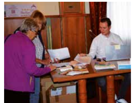
Gute Arbeit im Konferenzbüro