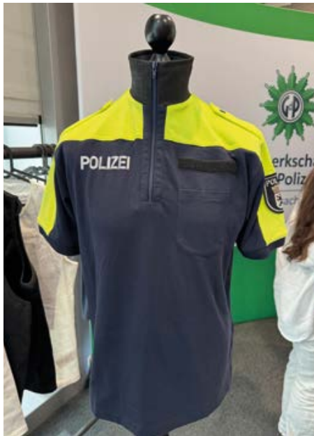
Beispiel dienstliches Polohemd

Ok, anfangs hatte ich schon ein Problem damit, mit einem Messer auf mir selbst rumzuschneiden, aber nachdem ich trotz mehrfacher Versuche nichts spüren konnte, erhöhte ich den Druck immer mehr. Was soll ich sagen ... NICHTS! ABSOLUT NICHTS! Der Stoff des Pullovers hing am Ende in Fetzen, aber das Cuttermesser schaffte es nicht durch das Stichschutzmaterial. Zur Vorfüh-