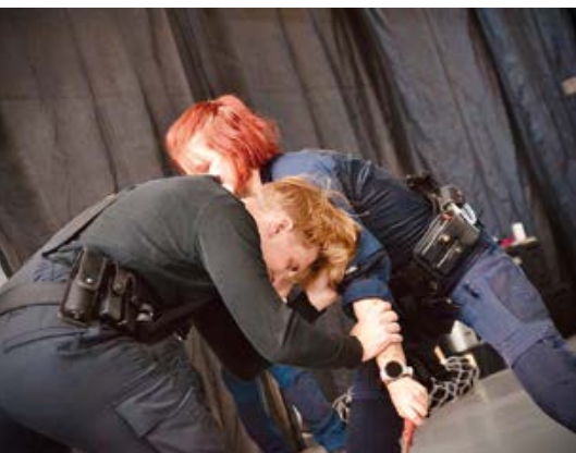
Zeitfenster für Schusswaffeneinsatz wird erarbeitet.