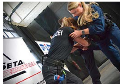
Kampf in der Nahdistanz