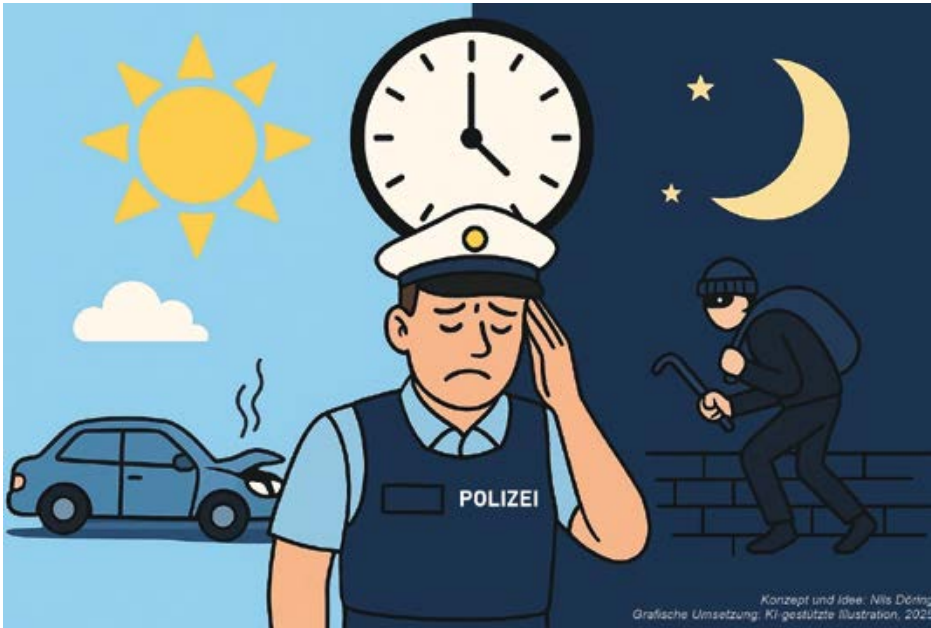
Konzept und Idee: Nils Döring Grafische Umsetzung: KI-gestützte Illustration, 2025

heitlichen Risiken mit den Jahren stark zunehmen können: So leiden viele Schichtarbeitende nach 15 bis 20 Jahren im Dienst zunehmend an chronischen Erkrankungen wie Schlafstörungen, Magen-Darm-Problemen, Herz-Kreislauf-Erkrankungen oder Kopfschmerzen. Besonders ausgeprägt ist das Risiko für Typ-2-Diabetes bei Menschen, die dauerhaft in der Nachtschicht arbeiten.