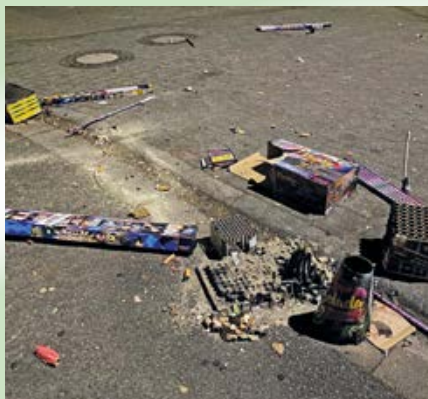
Die stille Bilanz des Jahreswechsels: Pyrotechnikmüll auf Gehwegen und Straßen