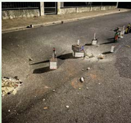
Wenn Feiertage zur Gefahr werden: Silvestermüll auf der Straße gefährdet Verkehr und Rettungskräfte.