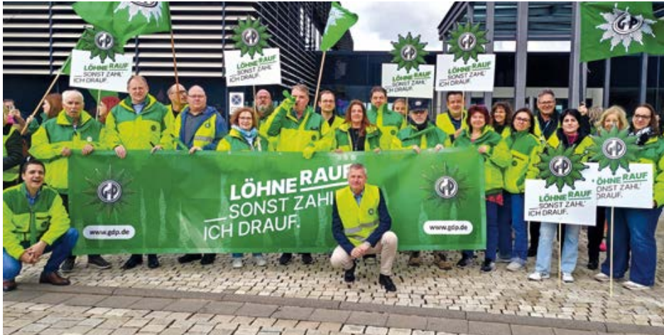
Die Tariffkommission der GdP Hessen