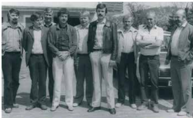
GdP-Fraktion im Bezirkspersonalrat der Polizei 1981