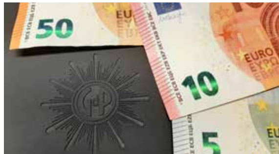
Eine gute Anlage: dein Beitrag für die GdP

wurde die Tarif- und Besoldungsentwicklung, die automatisiert in allen Beitragsgruppen berücksichtigt wird.