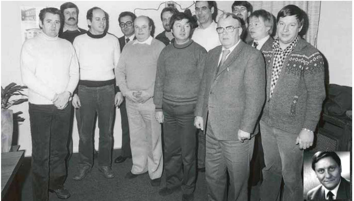
Erster Vorstand der neuen GdP-Bezirksgruppe Gießen (1981)