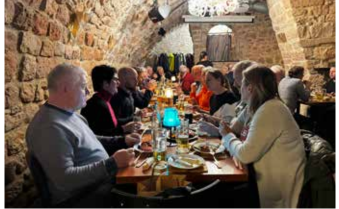
Blick in den historischen Gewölbekeller

dem Marktplatz befindet. Wer vorher nicht den Weihnachtsmarkt besuchen wollte, konnte so direkt um 19 Uhr zum „Market“ kommen. Der urige Gewölbekeller war wieder für uns reserviert. Schnell waren alle Sitzplätze belegt und die munteren Gespräche begannen. Der Vorstand begrüßte alle Anwesenden und hielt eine kurze Weihnachtsansprache und eröffnete nun „offiziell“ den Abend. Die ersten Getränke und auch die Speisen sollten nicht lange auf sich warten lassen. Neben einer kleinen Menüauswahl wurden unsere Weihnachtsgäste dieses Jahr mit einer tollen gemischten Vorspeisenplatte überrascht, die einen sehr guten Anklang fand. Auch das jährliche Gastgeschenk war wieder an jedem Sitzplatz zu finden. In diesem Jahr konnte man sich über ein kleines Holzbrett mit GdP-Loge erfreuen. Neben dem guten Essen wurden viele tolle Gespräche geführt, die sich von Urlauben und Wanderungen im Ausland, den täglichen Malesten bis hin zum dienstlichen Tagesgeschehen erstreckten. Es herrschte eine