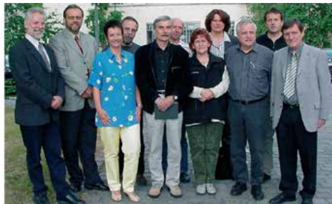
GdP-Fraktion im Personalrat des PP Mittelhessen 2001

zierung der Personalvertretungen vorzunehmen, so daß ab 2001 für sämtliche Bereiche und Beschäftigte