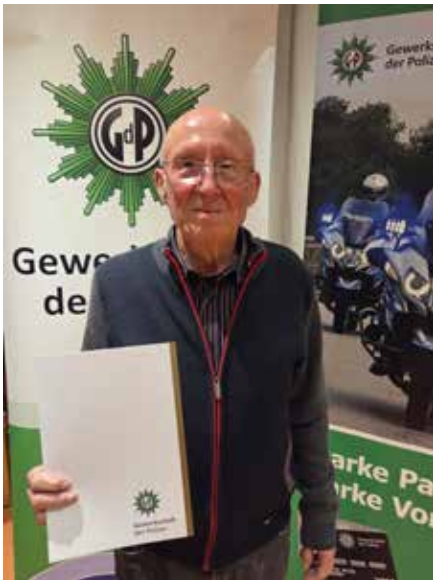
Überreichung der Jubiläumsurkunde zur 60-jährigen Mitgliedschaft in der GdP

Weiterhin war ihm folgender Satz wichtig: „Unseren Politikern sei gesagt, dass die heutige Polizei die demokratischste ist, die Deutschland je hatte. Dies