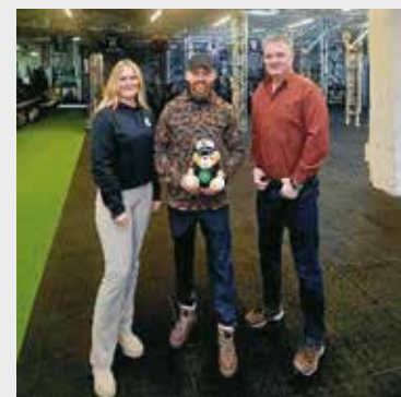
Per Handschlag zur Kooperationsvereinbarung

Mit der CrossFit Schmiede Kassel gewinnen wir einen starken Partner, der die besonderen Anforderungen unseres Berufs versteht. Die Kooperation bietet GdP-Mitgliedern nicht nur einen finanziellen Vorteil, sondern auch die Chance, körperlich und mental langfristig fit zu bleiben – in einer Gemeinschaft, die Leistung und Zusammenhalt verbindet.