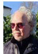
Karl-Heinz Arndt KG Kassel