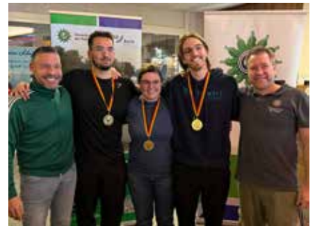
Platz 1 - DRK-Team

Silber und somit der zweite Platz ging an die Dienstgruppe -B- der Polizeistation Fritzlär. Bronze und somit der dritte Platz ging knapp... wobei das Wort „knapp“ hier