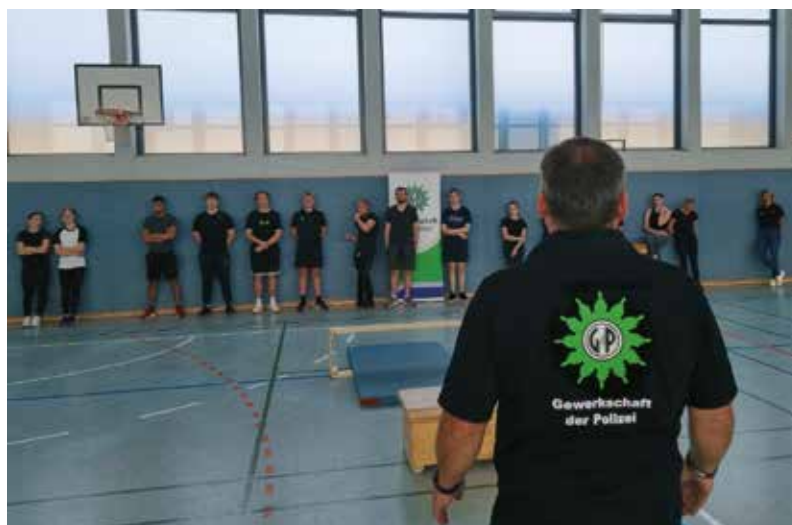
Vorhergehende Teilnehmende bei den Sportübungen

Mitzubringen sind ein Tablet oder Laptop und Sportbekleidung. Duschmöglichkeiten sind vorhanden. Die Verpflegung übernimmt die GdP.