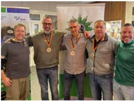
Platz 3 – Bau- und Umweltamt Landratsamt Schwalm-Eder