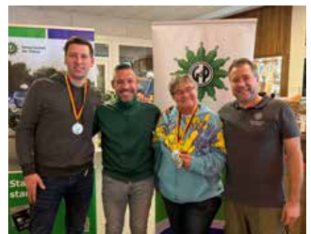
Platz 2 - DG B der PSt Fritzlär

völlig untertrieben ist – ein einziger Punkt, ein Pünktchen (!!!) betrug der Rückstand hinter Platz 2 – an das Bau- und Umweltamt des Landratsamtes Schwalm-Eder.