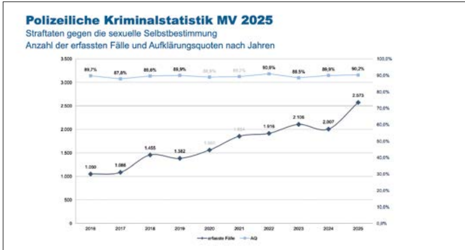
Polizeiliche Kriminalstatistik 2025: Kriminalität sinkt, Aufklärungsquote bleibt auf hohem Niveau

Quellen: Ministerium für Inneres und Bau MV, PM Nr. 70/2026 vom 24. März 2026