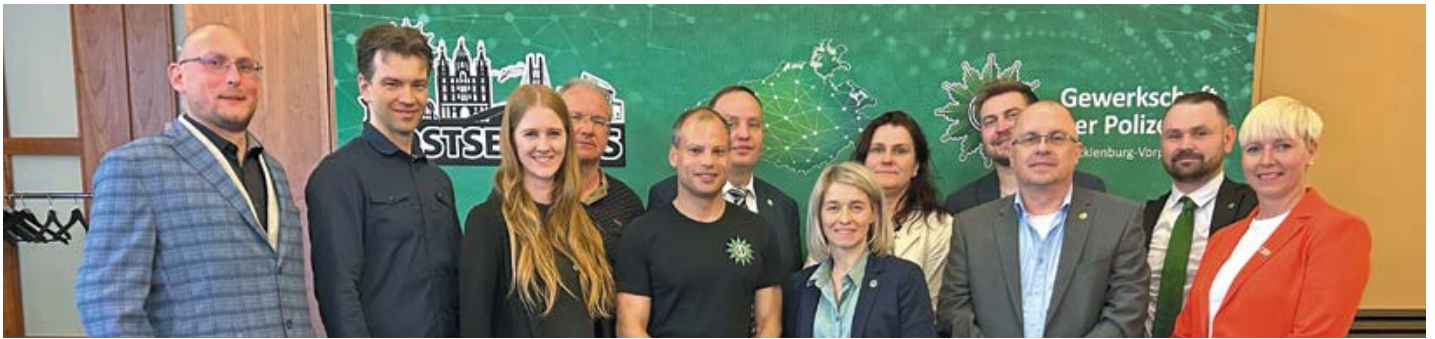
Der neue geschäftsführende Landesvorstand