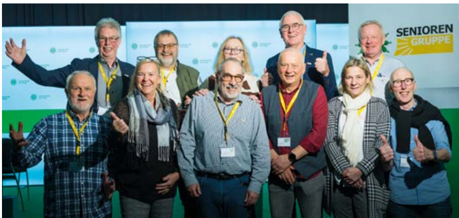
Die niedersächsische Delegation

Mein Fazit: eine rundum gelungene Veranstaltung, die gezeigt hat, wie wichtig und wirkungsvoll die Seniorenarbeit in der GdP ist. Vieles von dem, was in Potsdam angestoßen wurde, kann in die Praxis vor Ort übertragen werden. Der oft gehörte Satz „Die Veranstaltung war jeden Cent wert“ trifft es sehr gut. ■