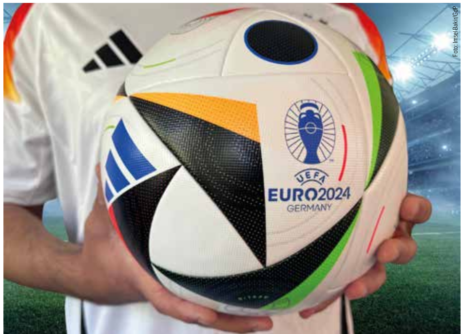
Ab dem 14. Juni rollt dieser Ball. Einen Tag später auch in NRW.

Was für die Fußballfans in Europa ein toporganisiertes Fußballturnier sein wird, bedeutet aber für die Kolleginnen und Kollegen im Umkehrschluss Urlaubssperre, 12-Stunden-Schichten und eine Mehrbelastung, die die vollen Überstundenkonten noch weiter füllen wird. Ganz vorne mit dabei die Bereitschaftspolizei: „Natürlich heißt es für uns, da zu sein, wenn wir gebraucht werden. Die Mehrbelastung muss aber mit Augenmaß erfolgen. Ein ‚Verheizen‘ der Kolleginnen und Kollegen darf es nicht geben“, meint Vorstandsmitglied und Experte für Fragen zur Bereitschaftspolizei