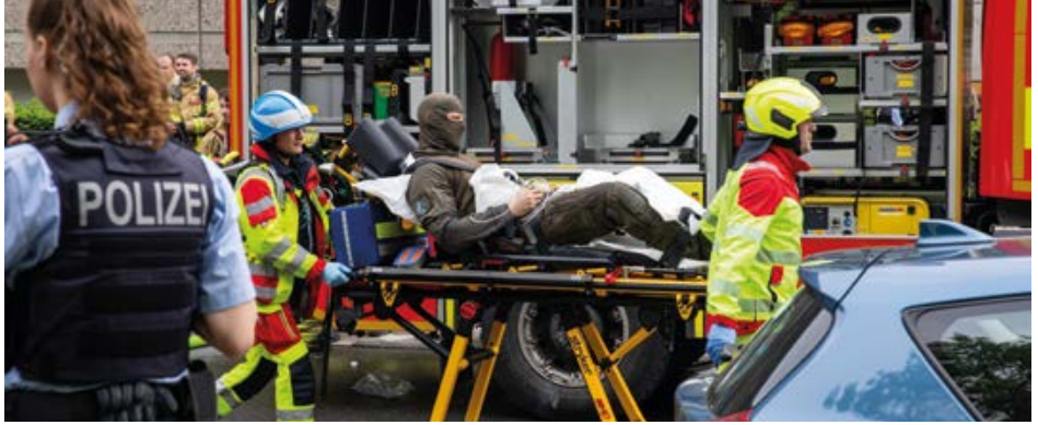
16 Kolleginnen und Kollegen wurden 2024 im Dienst schwer verletzt.