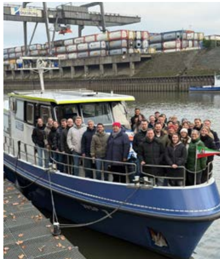
Sehr informativ: Die Teilnehmerinnen und Teilnehmer des Jugendforums 2025 besuchten die Wasserschutzpolizei in Duisburg.

Polizeiarbeit verändern und erleichtern. Von Anwendungen über Prozessoptimierung bis hin zu neuen Möglichkeiten für Lagearbeit und Dokumentation. In der Workshopphase