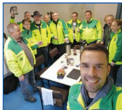
Unsere Betreuungsteams