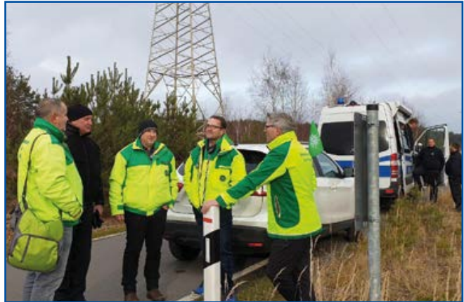
Besprechung der Betreuungsteams

gemanagt. Ende Gelände hat nicht die Bilder bekommen, die sie wollten. Sie haben keine Förder- oder Energieanlagen besetzt, es gab keine Verhaftungen, es gab keinen Wasserwerfereinsatz. Dennoch hatten wir leider vier verletzte Kollegen durch Gewalt von Ende Gelände. Das Einsatzkonzept hat gestimmt. Es gab aber auch Punkte, die nachbereitet werden müssen. Das ist nichts Ungewöhnliches bei der Größe eines solchen Einsatzes. Übernachtungen in viel zu kleinen Betten, Zimmer, die nicht verdunkelt werden