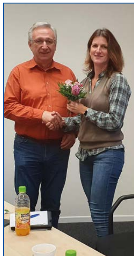
... und Glückwunsch

Erstaunlich war die große und rege Teilnahme der Mitglieder unserer Seniorengruppe. Auch sie nutzten diese Plattform, um Neuigkeiten zu erfahren und Probleme/Anregungen/Wünsche darzustellen. Unter anderem kam der Vorschlag, Pensionäre in die Einsatzbetreuung zu involvieren und gemeinsame Seminare zu