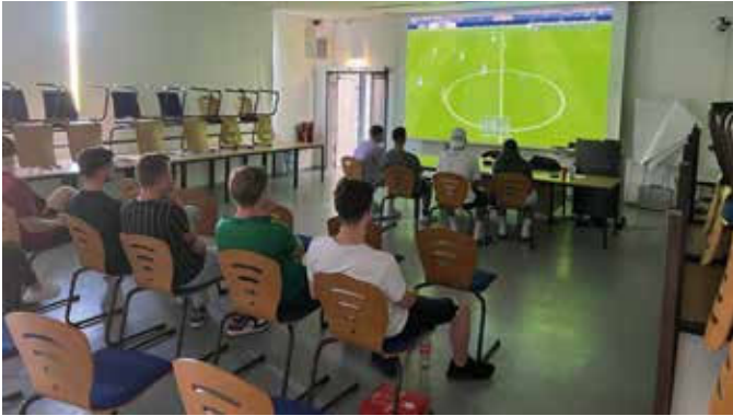
Volle Konzentration beim Zocken

Am 7. September 2023 lud die JUNGE AGRUPPE der Gewerkschaft der Polizei Sachsen-Anhalt zu einem Event der ganz besonderen Art und Weise ein. In den beiden Mehrzweckräumen der Fachhochschule der Polizei in Aschersleben durften sich Auszubildende und Studierende auf riesigen Leinwänden entweder bei einem FIFA 23 Fußballturnier auf der Xbox One oder bei einem Mario Kart Turnier auf der Nintendo Switch batteln.