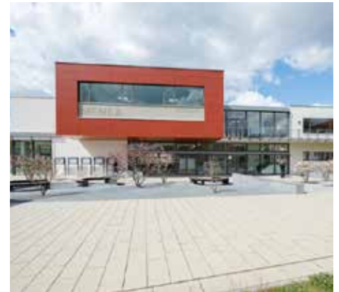
Das Hörsaal/Mensa-Gebäude der FH