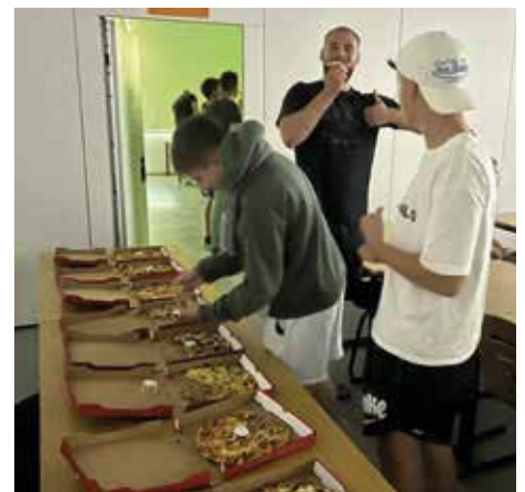
Eine kleine Stärkung gab es auch noch.