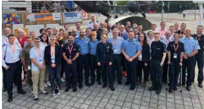
Die Teilnehmer beim obligatorischen Gruppenfoto

Der Seminarplan der anschließenden beiden Tage war prall gefüllt. Bevor die Referenten Vorträge hielten, erarbeiteten wir gemeinsam die LSBTTI*-Grundbegriffe und frischten unser Lexikon auf. Danach erörterten wir die aktuellen politischen Themen. Habt Ihr schon mal etwas von Femme-Feindlichkeit gehört? Der Begriff femme (französisch Frau) wurde benutzt als Gegenstück zur „maskulinen“ Butch im lesbischen Begehren. Es handelt sich also darum, dass zum Beispiel lesbische Frauen angeblich zu feminin aussehen. Da sind weitere aktuelle Themen wie TERF Trans, No Cops@Pride, LGBwithoutTI, die Toilettendebatte nur Beispiele.