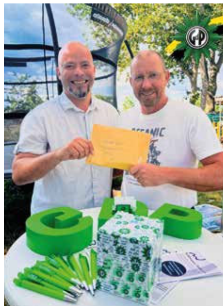
Die Übergabe des Spendenschecks