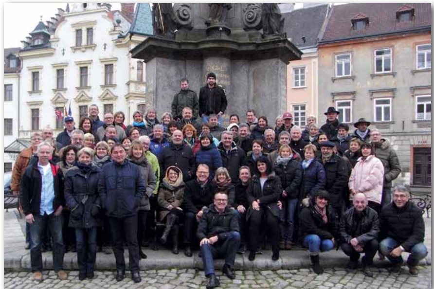
Unsere Unterfranken auf der Heimreise bei einem Zwischenstopp im romantischen Örtchen „Ellenbogen“ an der Eger.

natürlich mit dem weltbekannten Gerstensaft, in einer der ältesten Prager Bierstuben und einem Besuch des Weihnachtsmarktes war alles geboten.