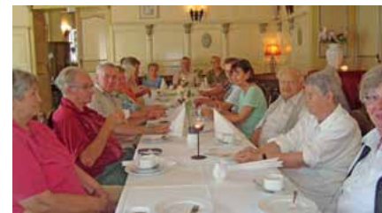
Kaffeetafel im edlen Outfit der Schlossherren von Neuhof.

Herzlichen Glückwunsch und auf weitere Jahre in unserer Gewerkschaft!