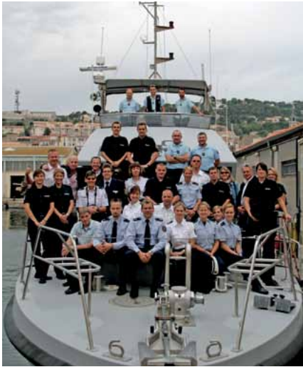
Die deutsche Delegation bei der Gendarmerie Maritime in Sète.

Mit einem Picknick auf den höchsten Klippen Frankreichs, dem Cap Canaille, und einem traumhaften Blick auf die Stadt Cassis und das azurblaue Meer endete diese für alle unvergessliche Woche.