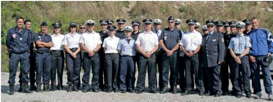
Gruppenbild mit dem Direktor der CRS-Region Südfrankreich (Mitte mit Sonnenbrille).

Nachdem im Juni Polizeischüler aus Frankreich Mecklenburg-Vorpommern besucht haben, wurde dieser Besuch Ende September erwidert. So reisten Polizisten aus Mecklenburg-Vorpommern zum traditionellen Binationalen Treffen zwischen deutschen und französischen Polizisten nach Nîmes in Südfrankreich an die dort beheimatete französische Polizeischule.