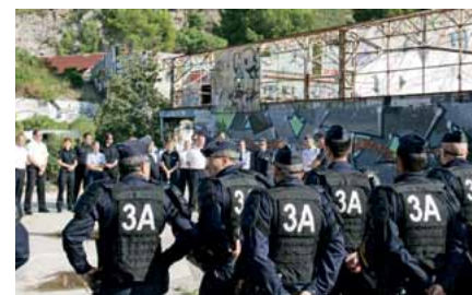
Vorbesprechung der Übung bei der CRS in Marseille.

Das Rahmenprogramm zeigte den Gästen aus Mecklenburg-Vorpommern und Rheinland-Pfalz die Schönheit Südfrankreichs. So stand ein Besuch des Aquädukts Pont du Gard ebenso auf dem Programm wie die Besichtigung der Stadt Aigues Mortes, die besonders durch ihren historischen Stadtkern und die vollständig erhaltene Stadtmauer beeindruckt.