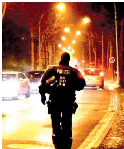
Probleme der Polizei ernst nehmen – Polizisten nicht alleine lassen.

Nun könnte man meinen, dass auch alle Landespolitiker, insbesondere gerade vor dem Hintergrund der aktuellen Sicherheitslage in Deutschland, zu einer solchen Erkenntnis kommen. Aber weit gefehlt.