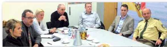
Der Innenminister findet die richtigen Worte für die saarländische Polizei.