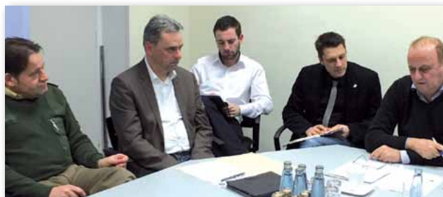
Man hört sich zu und lernt sich kennen.