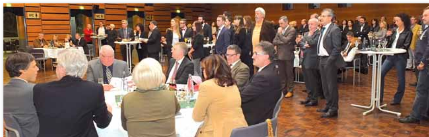
Wunderschöne Atmosphäre in der Dillinger Stadthalle