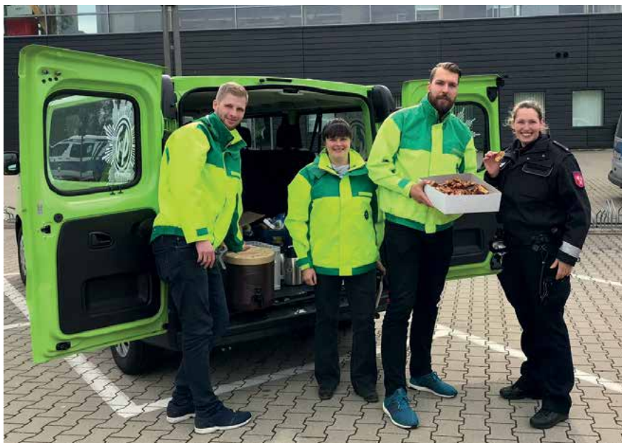
Die fleißigen Einsatzbetreuer der JUNGEN GRUPPE sind begeistert vom neuen GdP-Mobil

Das GdP-Mobil ist schon aus der Ferne sowohl durch die Fahrzeuggröße als auch durch die markante froschgrüne Farbe schnell zu erkennen. Dennoch besticht es nicht nur durch das außergewöhnliche Erscheinungsbild, sondern vor allem durch die neuen Möglichkeiten, welche sich nun für die Versorgung offenbaren.