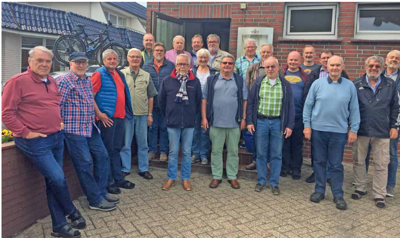
Immer gut besucht, das Seminar der Seniorengruppe.

A uch 2019 verschafften sich die Seminarteilnehmer der Seniorengruppe einen Überblick in Tossens. Seminarluft genießen, wo man noch am Abend „moin“ sagt.