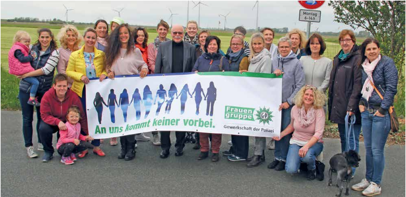
Senator für Inneres, Ulrich Mäurer, stellte sich den Fragen der Frauengruppe.

W ie fast in jedem Jahr waren die drei Tage in Tossens von Angestellten und Beamtinnen aus allen Bereichen der Innenbehörde gleich zu Jahresbeginn wieder ausgebucht.