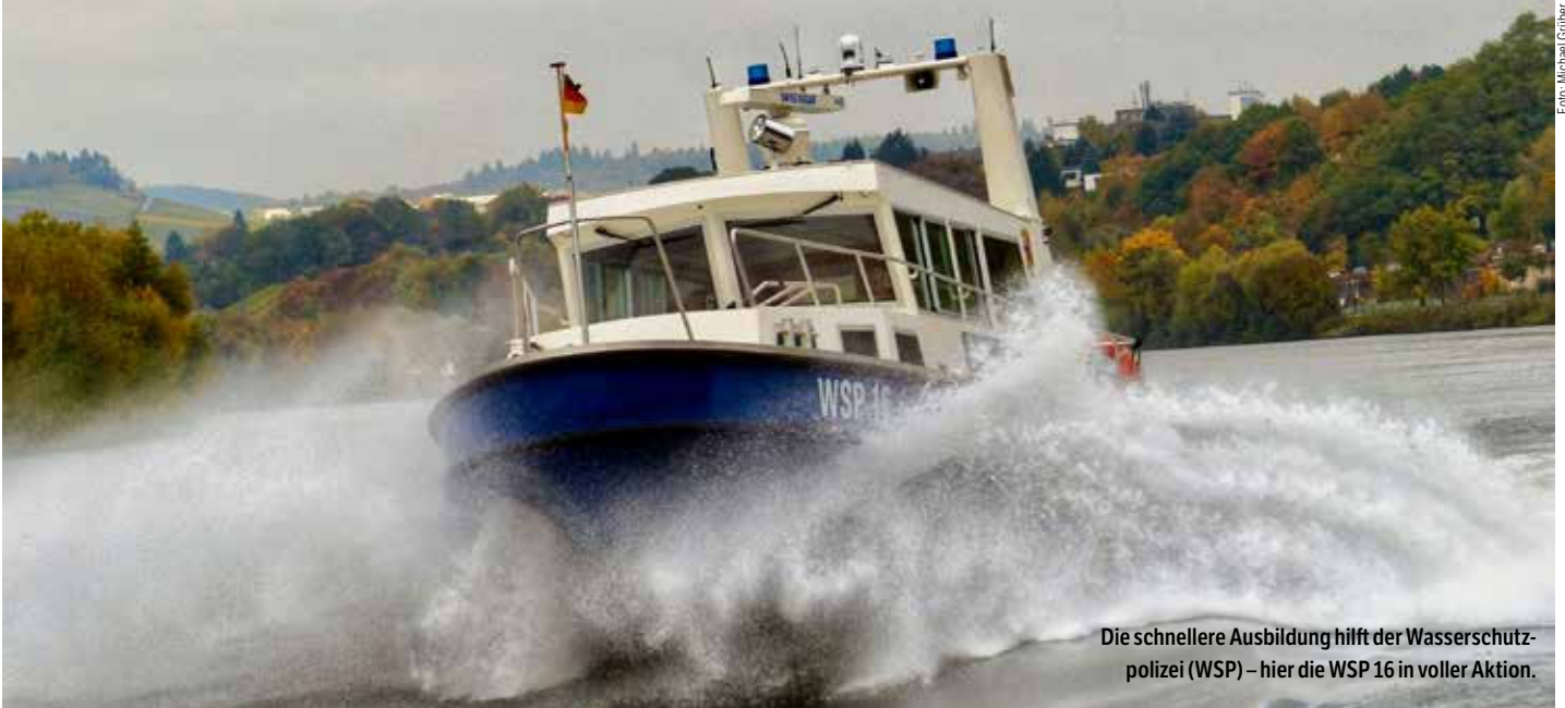
Die schnellere Ausbildung hilft der Wasserschutzpolizei (WSP) – hier die WSP 16 in voller Aktion.