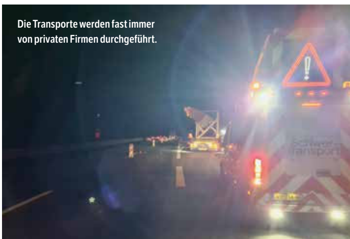
Die Transporte werden fast immer von privaten Firmen durchgeführt.