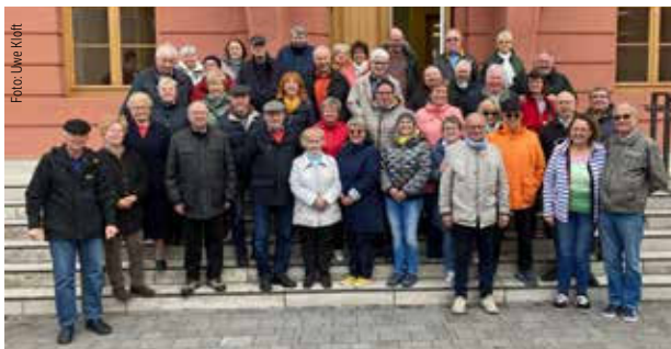
Mit dem Bus nach Mainz zum Landtag und zum ZDF – der Gruppe hat's gefallen.

Nach einem leckeren Mittagessen faszinierte uns die Medienwelt des ZDF auf dem Lerchenberg in Mainz. Einblicke in Technik und Gestaltung einer Sport-Liveübertragung, Kameraführung, Beleuchtung, Studiogestaltung, Kulissen und Regieanweisungen bei der Produktion von Fernsehsendungen erstaunten immer wieder. Ein Rundgang im ZDF-Fernsehgarten und ein Infofilm über die Mächte des ZDF heute journal schlossen den interessanten Besuch ab.