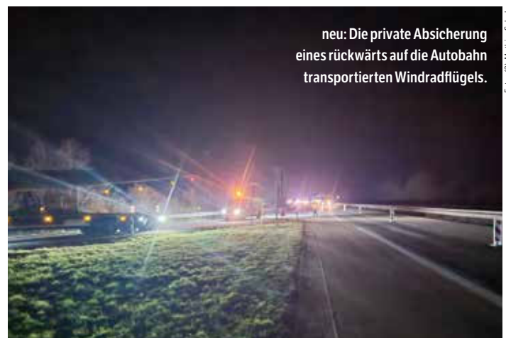
neu: Die private Absicherung eines rückwärts auf die Autobahn transportierten Windradflügels.