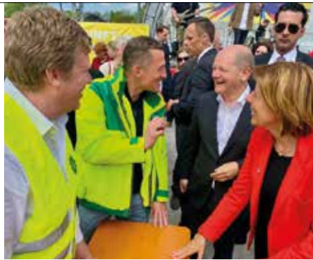
Sascha Büch überzeugt Olaf Scholz und Malu Dreyer von der Notwendigkeit, die Polizeizulage zu erhöhen und ruhegehaltstauglich zu machen.