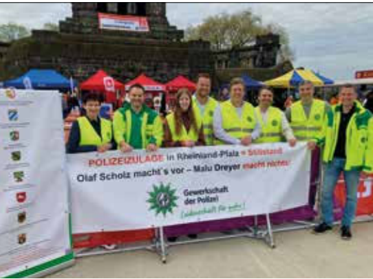
Raus zum 1. Mai, die BG Koblenz will mehr in Sachen Polizeizulage und nutzt den 1. Mai.