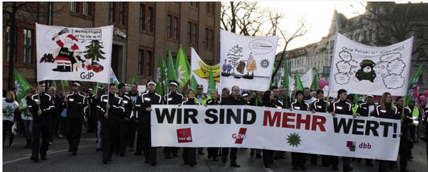
12 000-facher Ruf nach besserer Bezahlung: GdP ganz vorne mit dabei!

auch mittels bereitgestellter Busse anreisen. Da uns die ersten Sonnenstrahlen des Jahres begleiteten, haben wir, bei allem Frust über die Unbeweglichkeit der Arbeitgeber, den Tag im Kreis von 12 000 gleichgesinnten Demonstranten genossen. Am 7. 3. fuhren wir mit unseren Teilnehmerinnen und Teilnehmern zum Kongresshotel Potsdam am Templiner See. Dieses war Treffpunkt für die 3. Verhandlungsrunde. Einmal mehr haben wir dort den Gewerkschaftsführern, aber auch und vor allem den Vertretern der Arbeitgeberseite vor Augen geführt, dass die Beschäftigten des Öffentlichen Dienstes für ihre berechtigten Forderungen einstehen und auch vor Streiks nicht zurückschrecken.