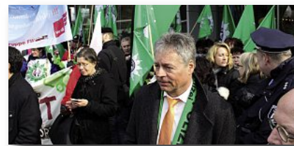
Auftakt dritte Tarifrunde vor Kongresshotel Potsdam am Templiner See.