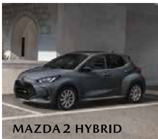
MAZDA 2 HYBRID