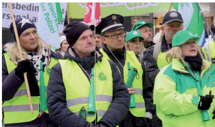
GdP-Protest während der Tarifverhandlungen.