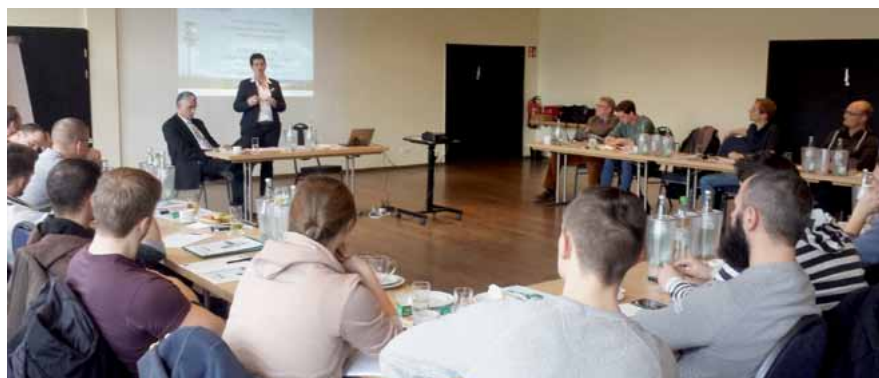
Die Teilnehmer verfolgten die Erläuterungen der Referenten.